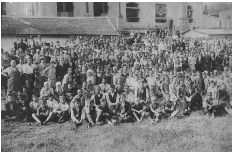
Radnici Srpske fabrike stakla, 1929. godina, Paraćin