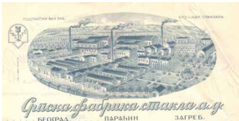
Memorandum Srpske fabrike stakla sa izgledom fabrike krajem 30-ih godina 20. veka