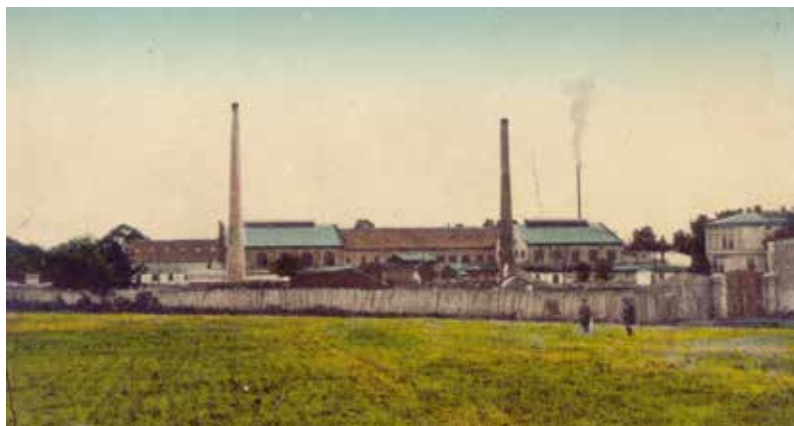
Srpska fabrika stakla u Paraćinu između dva svetska rata