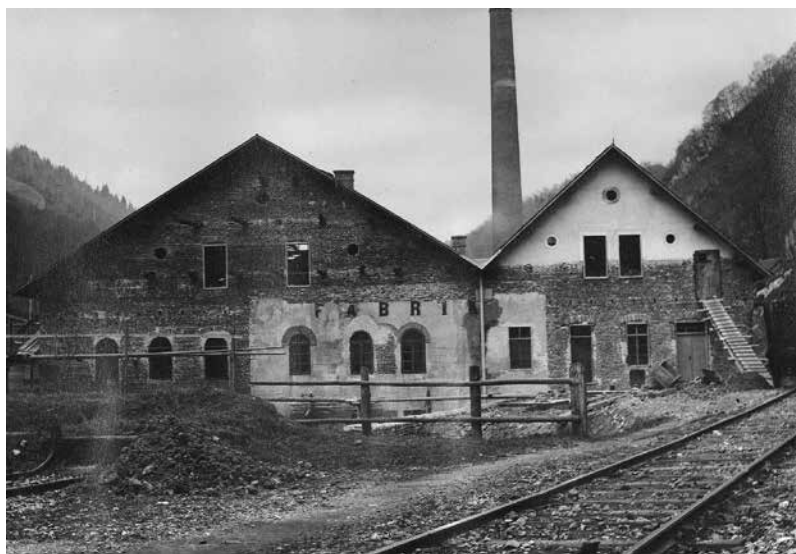
Objekti fabrike stakla Hrastnik, 1908.