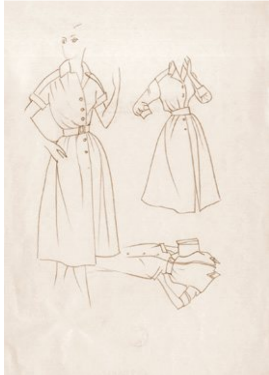
Сл. 8. Љубица Цуца Сокић, Скица женске хаљине, модна илустрација, графитна оловка 30 × 20 цм (Графичка збирка Народне библиотеке Србије, Заоставштина Љубице Цуце Сокић НБС, ЦСГр 5/34)

Но, поетика Цуце Сокић као модне илустраторке није само у складу са француском високом модом већ и њеном рецепцијом и конфигурацијом у Југославији и уже, Београду. У првом реду, блискост илустрација Сокићеве са модним цртежима модне креаторке Анђелке Слијепчевић (1931–2010) која крајем 1950-их борави у Паризу радећи за „Ланвин” (ŽARIĆ 2022), показује на који је начин модни диктат Кристијана Диора, чија модна кућа заједно са „Ланвином” и „Баленсијагом” представља моделе на сајму Мода у свети у Београду 1959. године, локализован у југословенској визуелној култури и култури одевања 1950-их и 1960-их. Заједничка иконографија са визуелним репертоаром насловница домаћих модних часописа такође није случајна. Она одсликава циркулацију западне високе моде и њено прилагођавање домаћим материјалним и естетским условима, нарочито када се узме у обзир да су насловне стране домаћих часописа, чак и када је