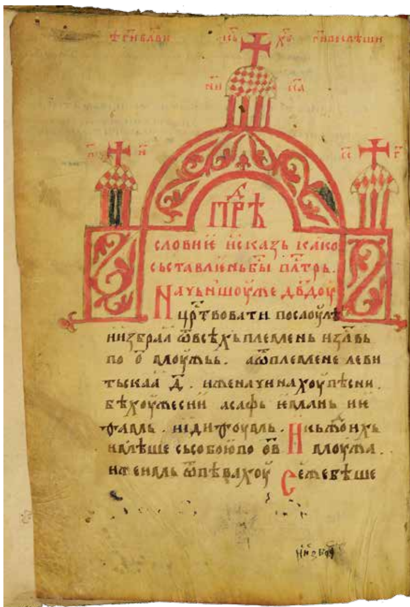
Сл. 2 Псалтир Бранка Младеновића, лист 1 в  Fig. 2 Branko Mladenović's Psalter, folio 1 v