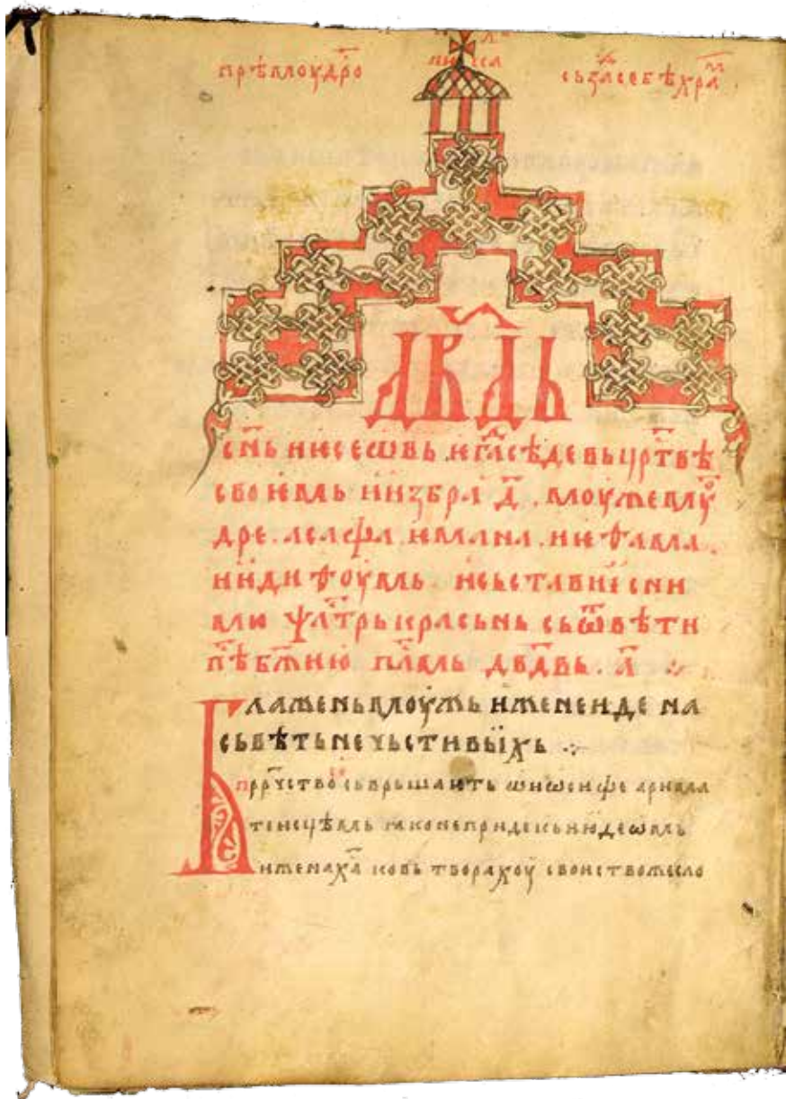
Сл. 3 Псалтир Бранка Младеновића, лист 4 в  Fig. 3 Branko Mladenović's Psalter, folio 4 v