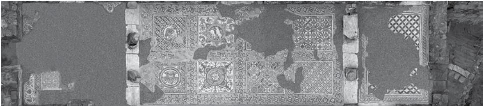
Сл. 8 Остаци мозаичке декорације нартекса Епископске базилике у Стобију, касни 5. или рани 6. век