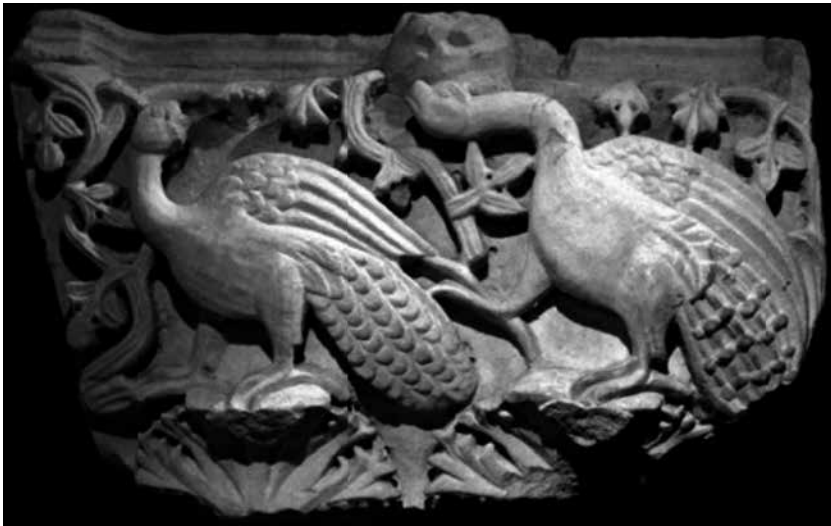
Сл. 3 Капител пиластера са представом пауна у оквиру разгранате лозице, крипта цркве Св. Димитрија у Солуну, 5. век (P. Niewohner, Byzantine Ornaments in Stone: Architectural Sculpture and Liturgical Furnishings , Berlin, 2021, 53, Fig. 125)

Fig. 3 Capital of a pilaster containing the representation of a peacock framed by branching vines, the crypt of the Church of St Demetrios in Thessaloniki, the 5 th century (P. Niewohner, Byzantine Ornaments in Stone: Architectural Sculpture and Liturgical Furnishings , Berlin, 2021, 53, Fig. 125)