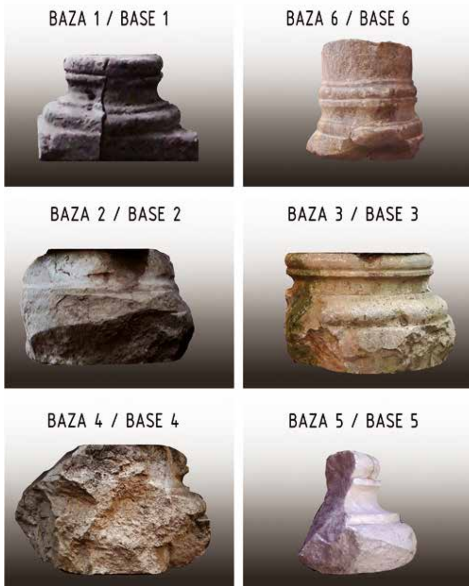
Сл. 1 Атичко-јонске базе пронађене на касноантичком налазишту Тимакум Минус

је престала архитектонска делатност у урбанизацији овог насеља (Петковић и Илијић 2012). У резултате римске делатности у области архитектуре спадају и базе стубова (сл. 1), које до сада нису биле предмет посебних истраживања.