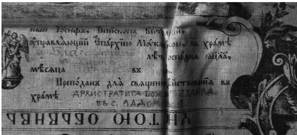
Сл.4. Антиминс из храма у Ладомировој.