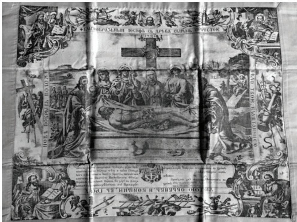
Сл. 2 Антиминс из храма у Медведжом.