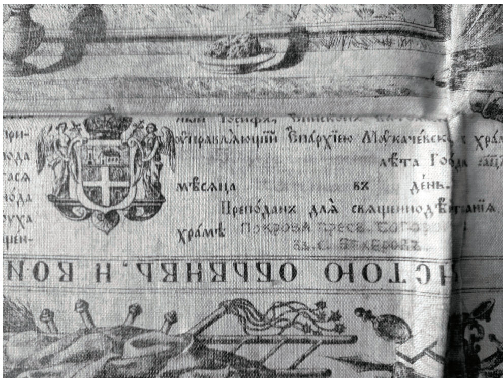
Сл.1. Антиминс из храма у Бехерову.