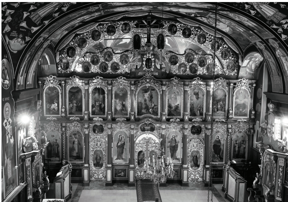
Сл.3. Унутрашњи изглед храма Ваведња Пресвете Богородице у Зрењанину.

дух прошлости и уметничких вештина усавршеног заната прве половине XIX века, кроз који се осликава дух класицизма. Овде видимо нову, сведенију естетику у односу на барокне иконостасе, симетрију компоновања са квадратним формама већих димензија, архитрав, тимпанон, канеловани стуб, квадратни рам без врежа и украсну атику као новине са перфектном израдом. Конструкција иконостаса и декоративни елементи су дакле урађени у класицистичком стилу, па позлаћене елементе декорације чине листови винове лозе са чокотима, храстов лист са жиром или без њега, лавров лист уплетен у венац, лишће папрати, цветови, те резбарски украси у облику веза и цветова којима су уоквирене саме иконе. Изнад престоних икона, изнад двери и изнад празничних икона налазе се гране и цветови. Овде видимо и амфоре као украсе на конзолама и изнад архитрава, као и акротерије на врху иконостаса. Све ово се налази у складу са новинама класицизма, који уводи превагу архитектуре, за разлику од барокне декоративне пластике, па као најбоље примере видимо стубове обавијене венцима и тимпаноне архитрава. Вероватно је да је исти дрворезбарски мајстор (дуборезачка радионица браће Јањић из Арада) израдио и иконостас, Архијерејски и Богородичин трон и певнице. Ширина иконостаса износи 9,80м, док