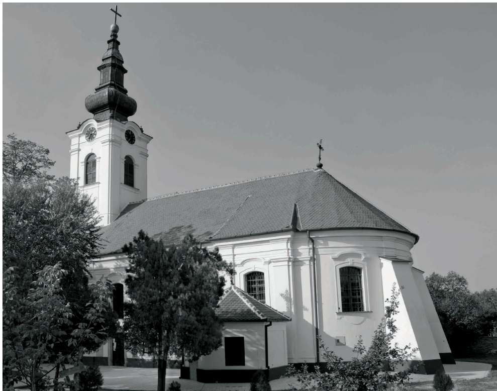
Сл.1. Храм Ваведења Пресвете Богородице са Капелом Преподобног Рафаила Банатског у Зрењанину (југо-источна страна).