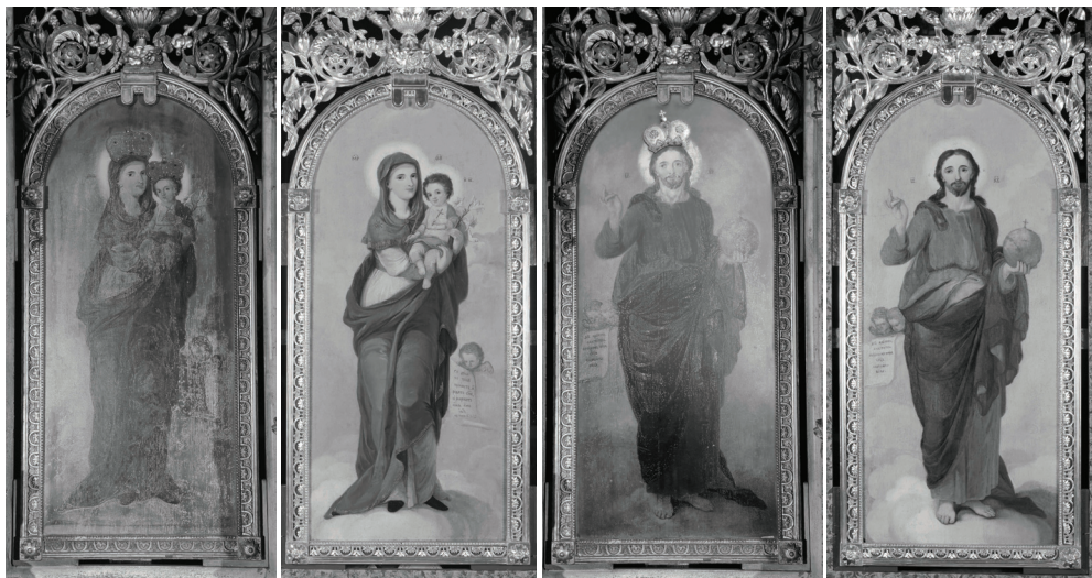
Сл.7-10. Изглед престоних икона Богородице са Христом и Господа Исуса Христа пре и после рестаурације и конзервације.