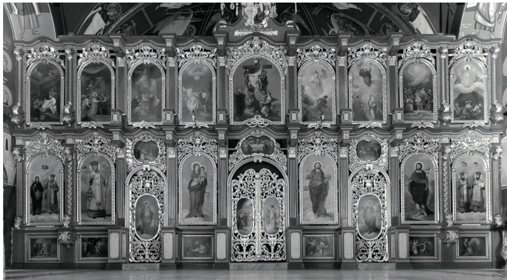
Сл.б. Изглед дела рестаурираног иконостаса, новог мермерног пода и живописа на зидовима и сводовима храма