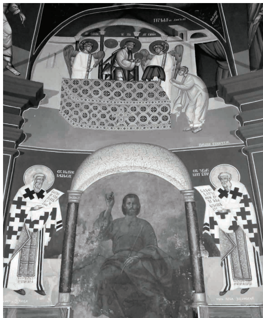
Сл.4. Зидно сликарство у полукалоти олтарске апсиде: