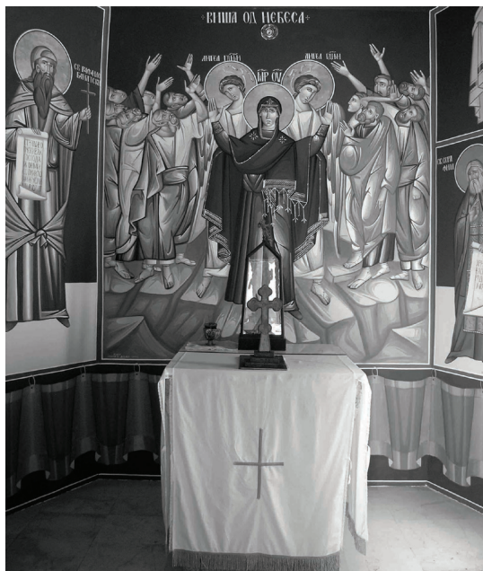
Сл. 9. и 10. Спољашњи и унутрашњи изглед капеле Преподобног Рафаила Банатског