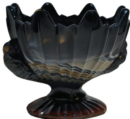
Oniks – inovativni materijal, osmišljen u laboratoriji staklare Hrastnik; na fotografiji posuda izrađena 1975. godine, koja predstavlja rimejk proizvoda iz 30-ih godina 20. veka izrađivanog u Sjedinjenim tvornicama stakla u Hrastniku

Automatizacija staklarstva ugrožavala je opstanak ručne izrade stakla, koja je za obe fabrike predstavljala tradiciju. Paraćinska fabrika traga za dugoročnim inostranim partnerima za koje može da obavlja poslove po narudžbini. Jedan od velikih ugovora koji je omogućio opstanak pogona za ručno-trgovačko staklo bio je ugovor za proizvodnju uložaka za termose za nemačkog proizvođača „Roptpunkt dr Anso Zimmermann“ (Arhiva SFS 1967). Hrastnik izlazak na međunarodno tržište ostvaruje saradnjom sa proizvođačem stakla „Saivo“ iz Firence (Steklar 1994).