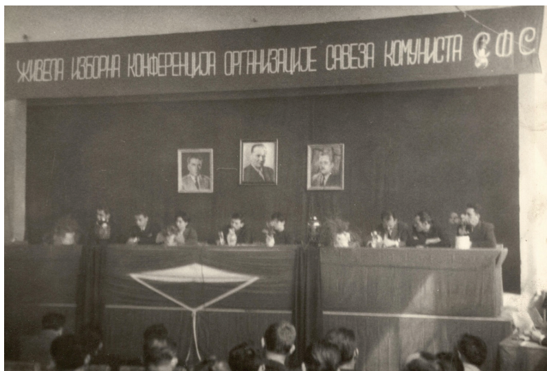
Zasedanje izborne konferencije Organizacije saveza komunista Srpska fabrika stakla, 50-ih godina 20. veka

sistema zasnovanog na utvrđivanju osnovnih proporcija investicija i akumulacije u privredi. Sredinom 1950. godine usvojen je Osnovni zakon o upravljanju državnim privrednim preduzećima i višim privrednim udruženjima od strane radnih kolektiva (Zbirka propisa iz oblasti privrede, 1951), čime je započeo proces demokratizacije privrede. Ovaj prelazak označio je kraj centralizovanog upravljanja i decentralizaciju odlučivanja u privredi (Horvat 1970). Srpska fabrika stakla, zajedno sa nekoliko preduzeća iz metalske i cementne industrije, izabrana je za jednu od oglednih fabrika za testiranje samoupravnih organa. Privremeni radnički savet izabran je 17. januara 1950. godine i brojao je 52 člana (Arhiva SFS 1950). Radnički saveti su preuzeli ulogu u upravljanju fabrikom, a ova inicijativa bila je deo politike koja je težila većem uključivanju radnika u procese donošenja odluka u privredi. U staklari u Hrastniku formiranje radničkog saveta započelo je u avgustu 1950. i ovaj upravni organ brojao je 60 članova (Hrastnik 1960).