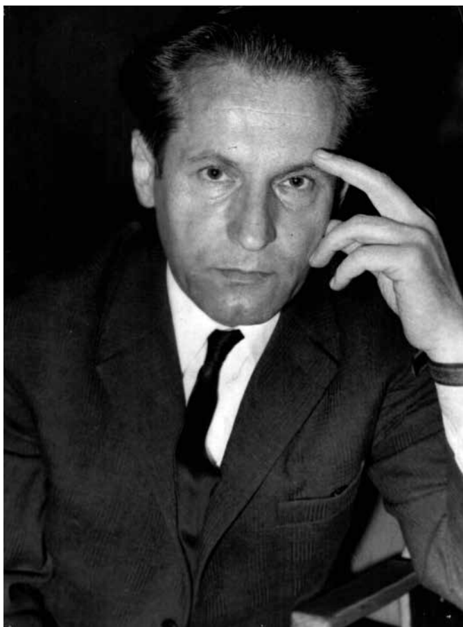
Slika 1. Zlatan Vauda

ostao upamćen kao umetnički rukovodilac i dirigent Dečjeg hora Radio-televizije Beograd 1 sa kojim je ovaj sastav stekao reputaciju važnog izvođačkog aparata koji je daleko premašivao standardne okvire dečjeg muziciranja (Sabo 2020, 196), Zlatan Vauda je saradivao i sa drugim ansamblima Radio-televizije Beograd, Horom i Orkestrom Jugoslovenske Narodne Armije, kao i sa značajnim brojem vokalnih i instrumentalnih solista. Ove aktivnosti omogućile su mu da, pored dirigentskog i pedagoškog rada, predstavi i sopstvenu kompozitorsku ličnost (Sabo 2010, 267). O tome svedoče dragoceni snimci njegovih dela, kao i ostvarenja drugih autora koja je dirigovao, a koja se nalaze u Fonoteci Radio Beograda.