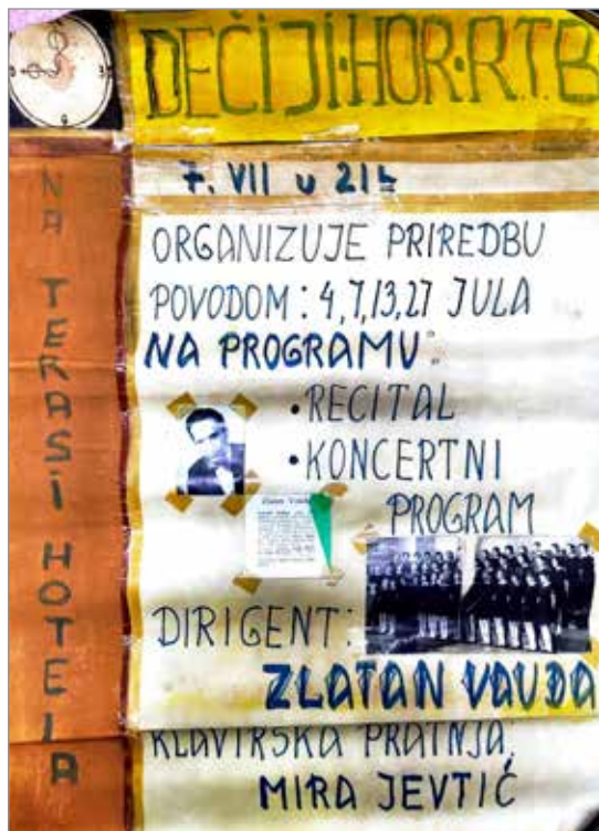
Slika 5. Ručno rađen plakat