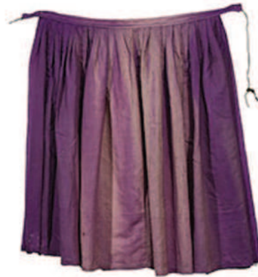
Pregača (EM, inv. broj 42057)