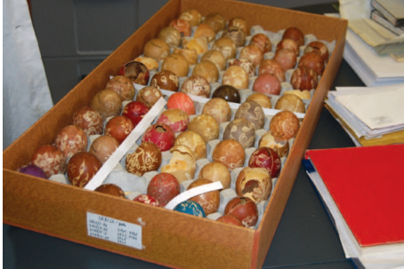
Uskršnja jaja iz Srbije, nabavio N. Zupanič 1918. godine.