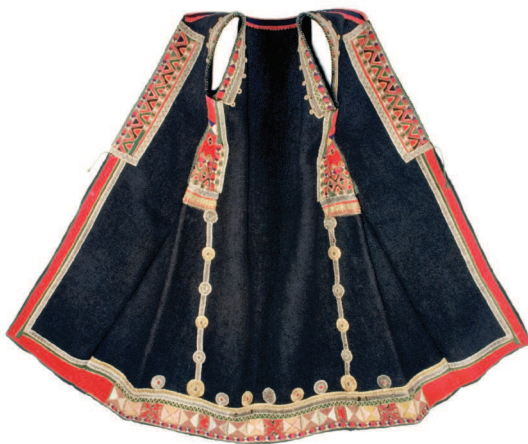
Zubun (EM, inv. broj 42038)