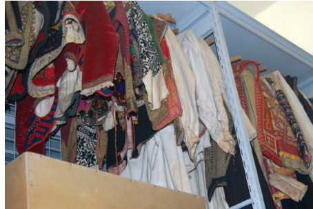
Delovi narodne nošnje iz Srbije u zbirci Slovenskog etnografskog muzeja.