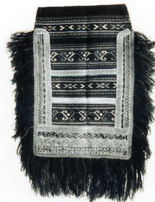
Pregača (EM, inv. broj 33323)