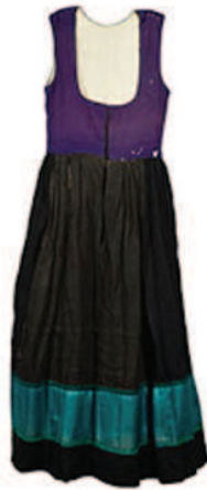
Haljina (EM, inv. broj 42056)