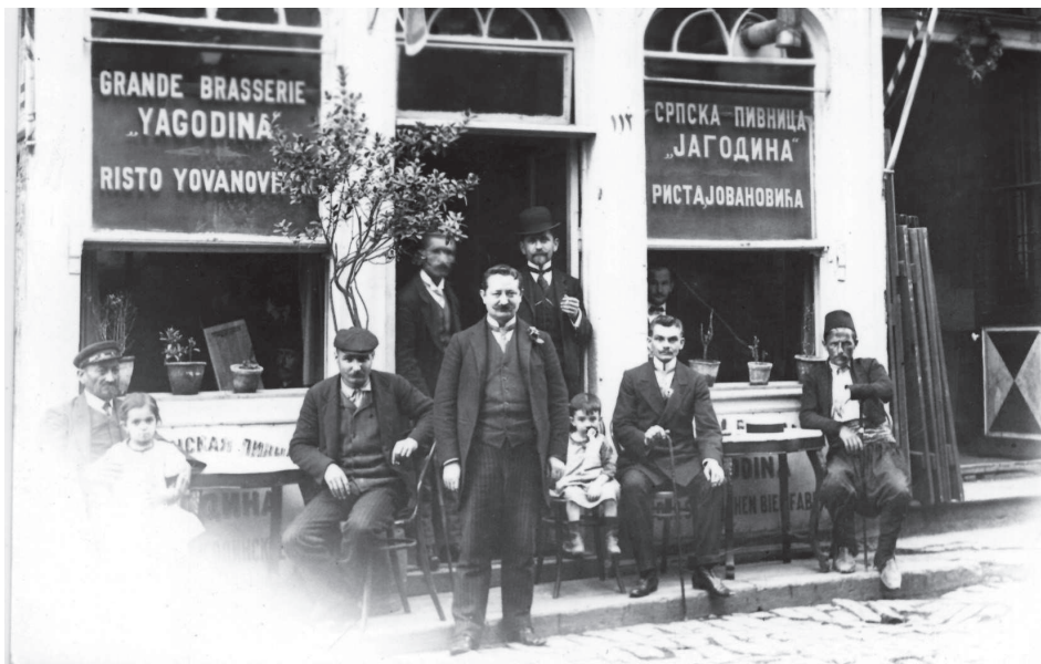
Fotografija koju je Niko Zupanić snimio putujući po Srbiji. (Dokumentacija SEM)