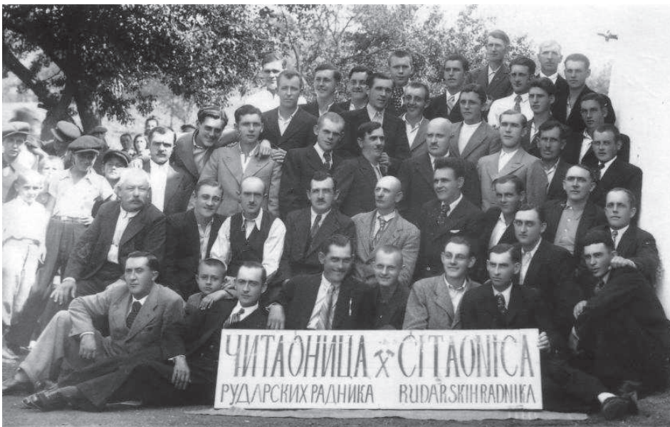
Slika 2. Grupni portret članova rudarske čitaonice (Srpska čitaonica, Irig).