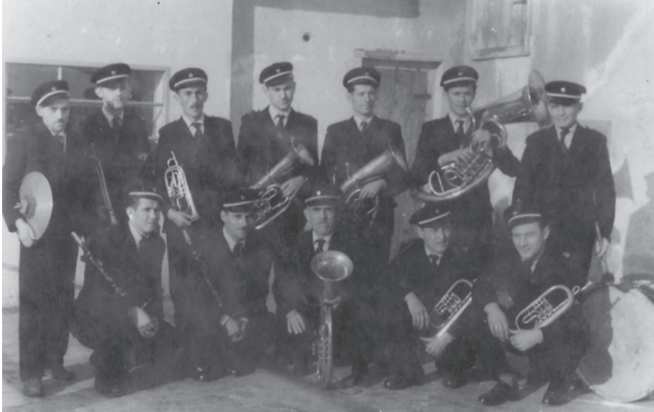
Slika 1. Rudarski orkestar u Vrdniku (Srpska čitaonica, Irig).