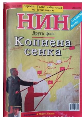
НИН 2525, 2526, 2527

Насловне стране српског недељника НИН представљају други део одабраног корпуса и бројније су у односу на део корпуса на немачком језику, што је било и очекивано, узимајући у обзир чињеницу да се одабрани догађај одвијао на нашем подручју, па је у свих 10 бројева објављених у периоду од краја марта до јуна тематизовано управо НАТО бомбардовање СРЈ.