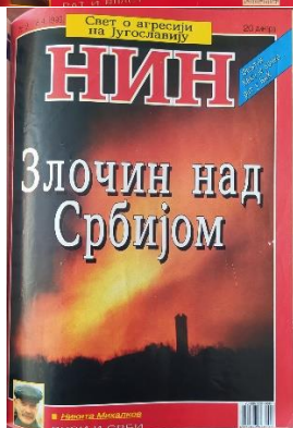
НИИ 2518, 2519, 2520, 2521