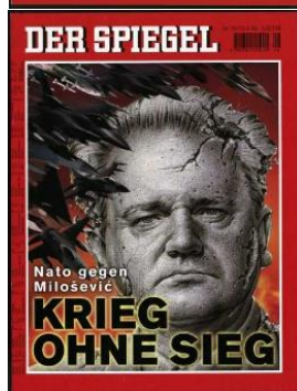
Der Spiegel 13/99, 14/99, 15/99, 16/99