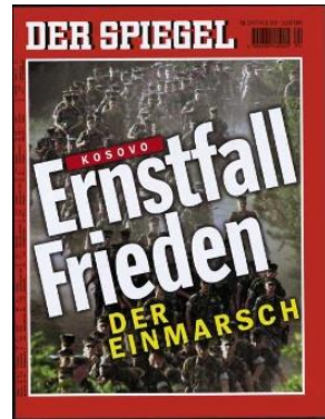
Der Spiegel 17/99, 23/99, 24/99

Свака од издвојених насловних страна садржи визуелни и вербални део, што потврђује поменути карактеризацију истих као мултимодалних текстова.