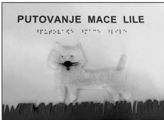
Slika 5 – Ručno pravljen taktilna slikovnica sa pričom „Putovanje mace Lile” (na početku stranice naziv priče na crnom tisku i Brajevom pismu, na srednjem delu stranice prikazana maca sa glavnim detaljima na travi) (Klarić, 2016)

Pregledom primera stranica taktilne slikovnice može se videti da je tekstualni sadržaj prikazan na oba pisma i da je skraćen tako da ono što je suštinsko stane na jednu stranicu. Nazivi pojedinih prikaza su takođe prikazani na oba pisma. Ilustracije/slike su prikazane taktilno i pravljene su od različitih materijala koji donekle podsećaju na teksturu predmeta/biljaka/životinja u realnom životu. Može se primetiti da ni jedna slika nije pretrpana detaljima koji su inače prikazani vrlo distinktivno što je neophodno za efektivnu taktilnu percepciju. Ono što je još od izuzetne važnosti, a na slikama se može videti, jeste to što su stranice ukoričene velikom spiralom koja omogućava da se stranice lagodno okreću i da budu u ravni kada je knjiga otvorena. Takođe se može zapaziti da su korišćene boje koje su približne realnom izgledu prikaza za decu koja mogu da koriste i vizuelno čulo sem taktilnog.