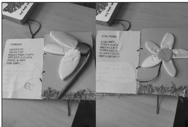
Slika 2 – Ručno pravljená slikovnica na temu Vesnici proleća (sa leve strane tekst na crnom tisku i Brajevom pismu, sa desne strane cvet visibaba u travi) (Perković, 2019)