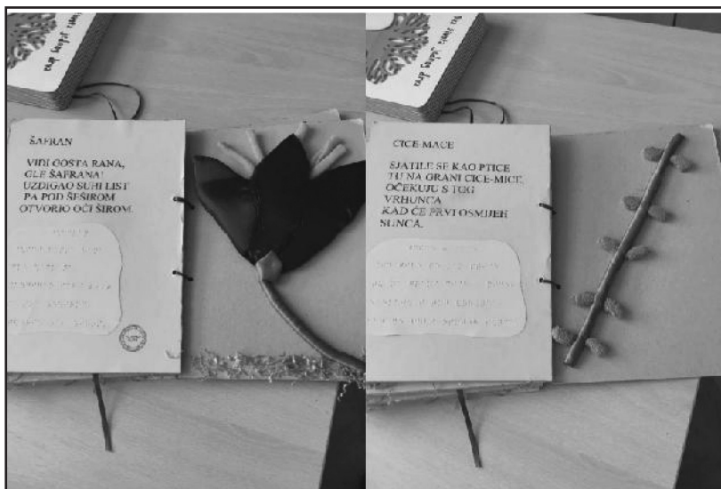
Slika 3 - Ručno pravljeni slikovnica na temu Vesnici proleća (sa leve strane tekst na crnom tisku i Brajevom pismu, sa desne strane cvet šafrana u travi) (Perković, 2019)