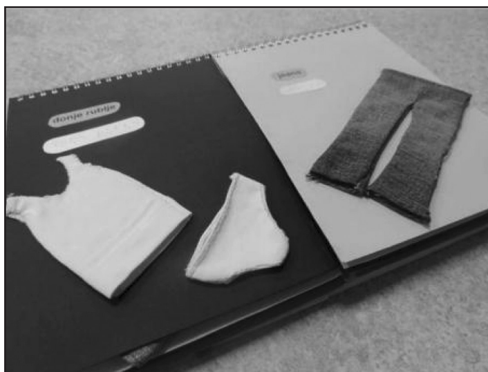
Slika 4 – Ručno pravljeni slikovnica na temu odevnih predmeta (na početku stranice naziv odeće na crnom tisku i Brajevom pismu, na srednjem delu stranice odevni predmeti od originalnih materijala) (Klarić, 2016)