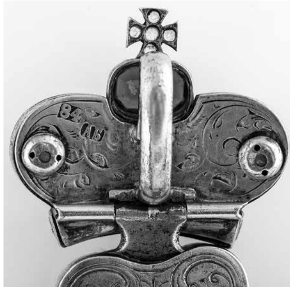
Сл. 8 Детаљ са жиговима на полеђини круне у надвишењу Fig. 8 Detail with seals on the reverse of the crown