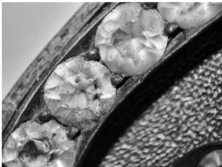
Сл. 4 Брилијант од стакла са типичном инклузијом – округлим гасним мехурићем (Извештај: Д. Јовановић)