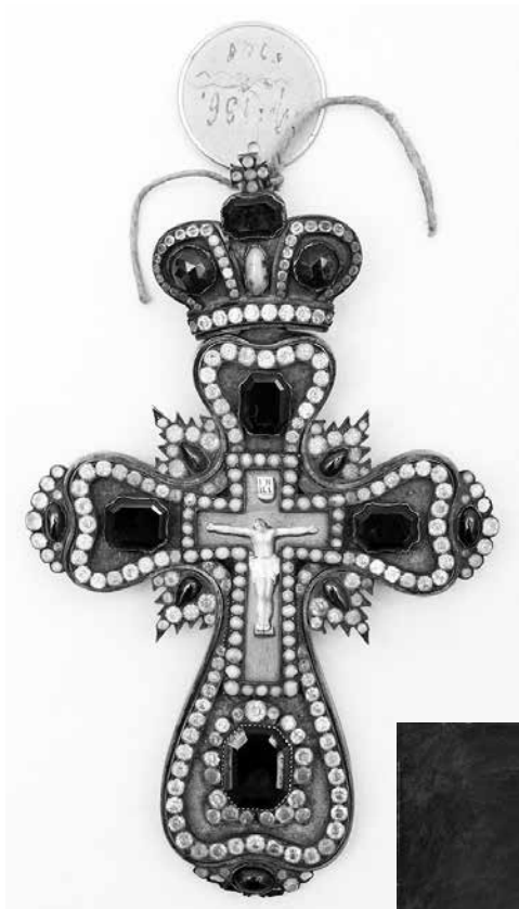
Сл. 1 Изглед крста пре конзервације Fig. 1 Appearance of the cross before conservation