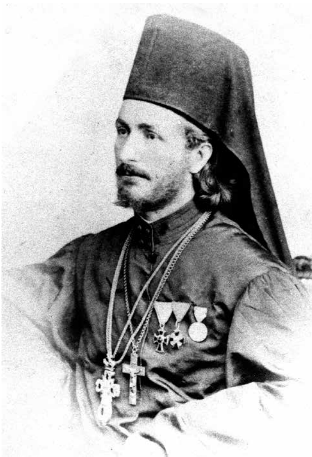
Fig. 3 Archimandrite Nićifor Dučić, around 1866 (SANU-F 206/2)