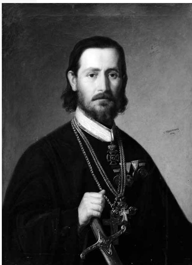
Сл. 2 Нићифор Дучић, уље на платну, Стева Тодоровић 1874, (САНУ)