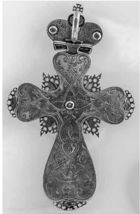
Сл. 7б Изглед полеђине крста Fig. 7b Appearance of the reverse of the cross