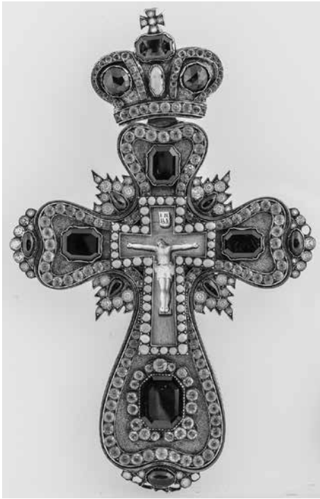
Сл. 7а Крст након чишћења и конзервације Fig 7a The cross after cleaning and conservation