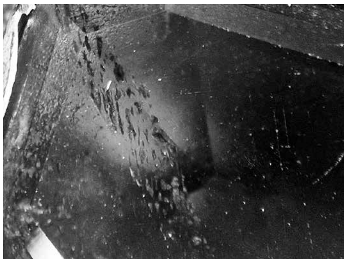
Сл. 5 Природне инклузије у великом гранату обрађеном фасетирањем у степеничасту форму (Извештај: Д. Јовановић)