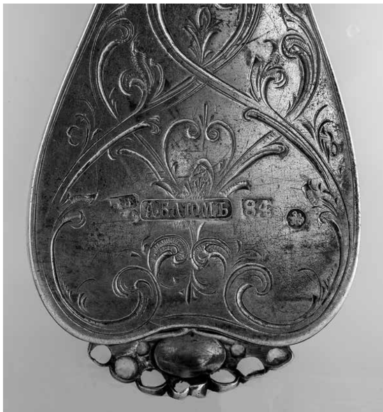
Сл. 9 Жигови на доњем делу полеђине крста Fig. 9 Seals on the reverse in the lower segment of the cross