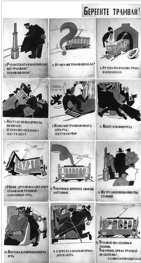
Илл. 8. «Окно сатиры Главполитпросвета» № 210 «Берегите трамвай!», май 1921 г. Художник М. М. Черемных, автор текста В. В. Маяковский.

менты фигур (РОСТА № 740 «1) Мы подбили капиталу одну щеку...», декабрь 1920 г. — «но ручки сложа нельзя сесть...» (Маяковский 1957: 262), ГПП № 364 «Вот что для голодающих прислали из-за границы государства, ассоциации и частные лица», октябрь 1921 г. — «9. А ты чего ж, дядя, / сидишь, на чужие жертвы глядя? 10. Шарь не покладая рук ты, 11. собери и деньги и продукты, 12. и всё, что собрать смог, / беги сдавать со всех ног» (Маяковский 1957: 415). Важную роль играла «метонимическая техника» (изображение части вместо целого и вида вместо рода) (Кумер 2016: 217). Отрицание передавалось визуальными средствами: перечеркнутой картинкой (на плакате ГПП № 362 «1) В Советской России не может быть никакого царя» (сентябрь 1921 г.) перечеркнута фигура царя) или словом (РОСТА № 581 «1) Если даже окончена будет война...» (ноябрь 1920 г.) и ГПП № 135 «1. Мы воевали много...», апрель 1921 г.) — «война», ломаной линией изображения (ГПП № 210 «Берегите трамвай!», май 1921 г. — «трамвай