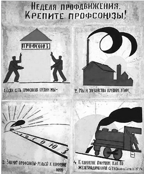
Илл. 11. «Окно сатиры Главполитпросвета» № 14 «Неделя профдвижения. Крепите профсоюзы!» 1) Если сеть профсоюзов крепим мы...», февраль 1921 г. Художник и автор текста В. В. Маяковский.