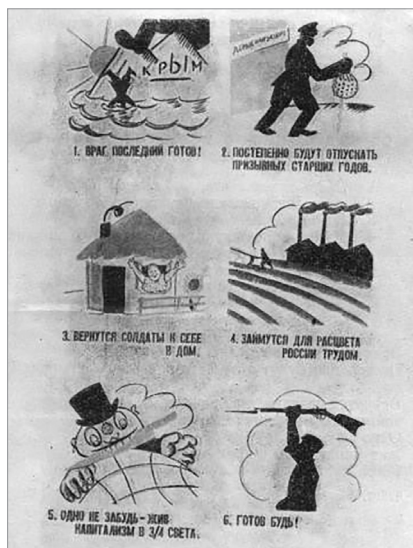
Илл. 9. «Окно сатиры РОСТА» № 791 «1) Враг последний готов», декабрь 1920 г. Художник и автор текста В. В. Маяковский.