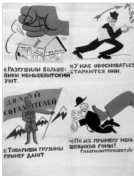
Илл. 1. «Окно сатиры Главполитпросвета» № 68 «1) Разрушили большевики меньшевистский уют...», март 1921. Художник и автор текста В. В. Маяковский.

3. Разрушение символов (памятников и т. п.) старого строя и создание новых («план монументальной пропаганды») РОСТА № 494 «Долой волокиту! Да здравствует революционная инициатива!» (ноябрь 1920 г.).