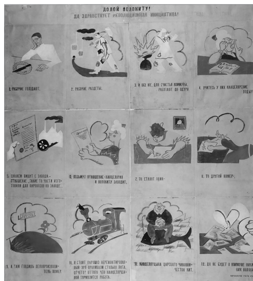
Илл. 10. «Окно сатиры РОСТА» № 494 «Долой волокиту! Да здравствует революционная инициатива!», ноябрь 1920 г. Художник и автор текста В. В. Маяковский.

не трамвай — сломанный урод» (илл. 8), метафорической и метонимической символизацией — ворона, сидящая на каком-либо предмете, означала за-пустение; остановившееся производство изображалось как фабрика, кото-рая не дымит (ГПП № 144). (Кумер 2016: 217–218).