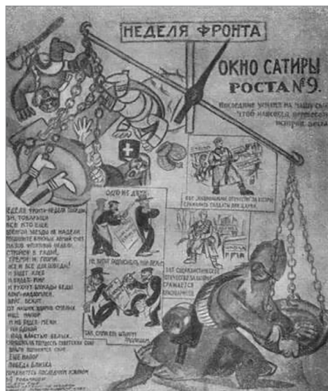
Илл. 6. «Окно сатиры РОСТА» №9 «I. Неделя фронта — неделя победы», середина января 1920 г. Художник М. М. Черемных, автор текста В. В. Маяковский.

4. Повествовательный лубок, отличающийся коротким сюжетом, в основе которого может быть дробление, сопоставление, концовка, вопрос-ответ.