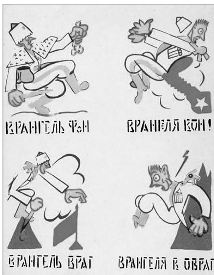
Илл. 5. «Окно сатиры РОСТА» №473 «Врангель — фон, 2. Врангеля вон!», конец октября — начало ноября 1920. Художник и автор текста В. В. Маяковский.