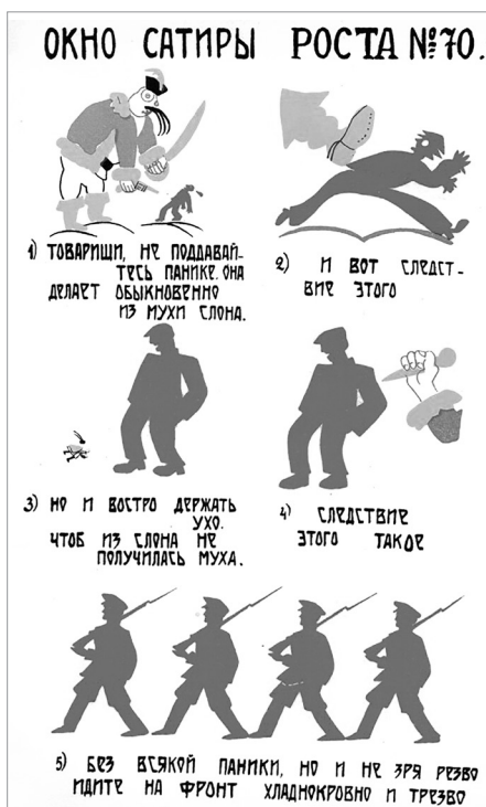
Илл. 7. «Окно сатиры РОСТА» № 70 «1) Товарищи, не поддавайтесь панике...», май 1920 г. Художник и автор текста В. В. Маяковский.

Важным средством визуальной выразительности был колорит плакатов. «Окна РОСТА» выполнялись яркими красками, без полутонов и передачи объема, красный цвет использовался как обозначение положительной