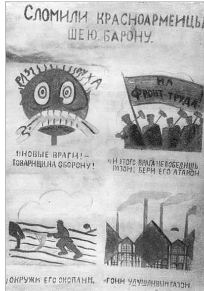
Илл. 12. «Окно сатиры РОСТА» № 571 «Сломали красноармейцы шею барону», ноябрь 1920 г. Художник и автор текста В. В. Маяковский.

Для подписей к плакатам была характерна тенденция к императивно-сти, лаконизму 12 и динамичности фразы, ритмической организации. В текстах «Окон» отсутствовало описание — оно было «вытеснено» в рисунок, поэтому факты, явления только обозначались. Главная смысловая нагрузка заключалась в том, чтобы передать необходимость того или иного действия или дать указание. Например, в РОСТА № 443, октябрь 1920 г.: «1. Лезет барон. 2. Лезет шайка баронова. 3. Барона — вон! 4. Шайку вон его!» (Маяковский 1957: 184).