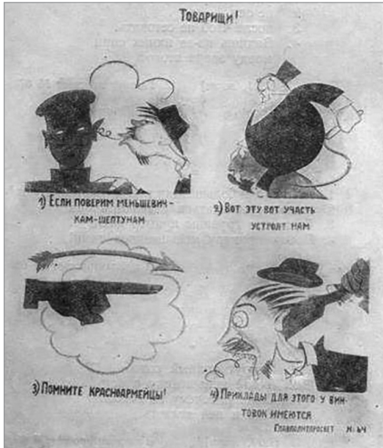
Илл. 2. «Окно сатиры Главполитпросвета» № 64 «Товарищи! 1) Если поверим меньшевичкам-шепунам...», март 1921 г. Художник и автор текста В. В. Маяковский.