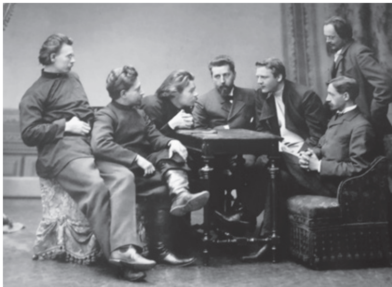
Рис. 1. М. Горький и члены литературной группы «Среда». (1902)

Видимо, это объясняется нелюбовью Короленко ходить к фотографам. Единственное доказательство серьезного творческого взаимодействия двух нижегородцев, которое нам удалось найти в горьковской иконографии, и то посмертной, это картина В. И. Авериной «А. М. Горький и В. Г. Короленко в Нижнем Новгороде» (1946) ( А. М. Горький в изобразительном искусстве 1969: 121). На ней писатели беседуют, сидя на скамье под деревом на Откосе. Перед ними открывается вид на одно из самых красивых мест Нижнего Новгорода, где происходит слияние Оки и Волги.