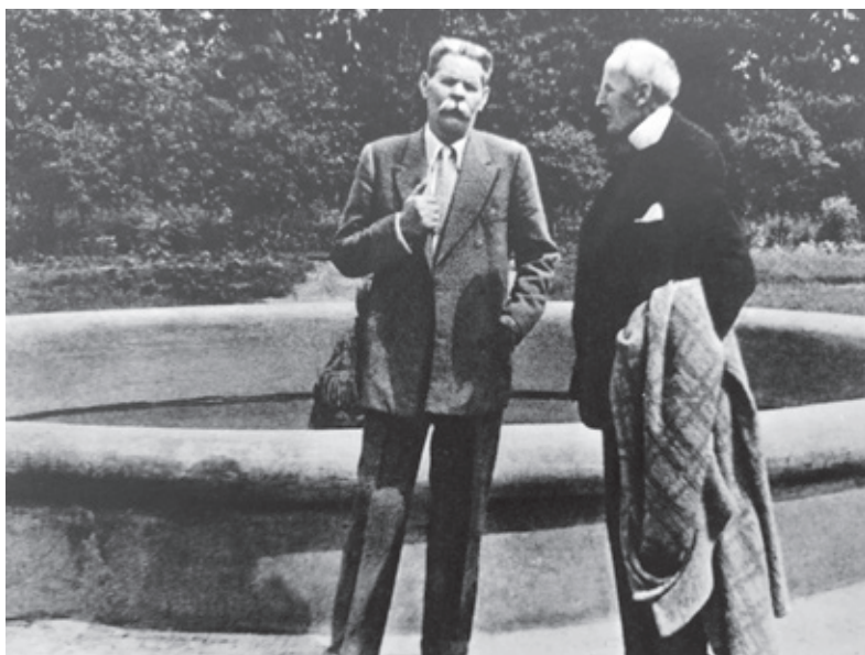
Рис. 3. А. М. Горький и Р. Роллан (1935)

что Горький в этот период был председателем Петроградской комиссии по улучшению быта ученых, под эгидой которой в городе начал работать клуб научной интеллигенции (Дом ученых). Осенью 1920 г. по приглашению Горького клуб посетил Уэллс. Английский писатель в значительной степени способствовал комплектованию Читальни клуба заграничными изданиями, что подтверждается перепиской Горького с Уэллсом ( Архив А. М. Горького 1960: 68–71).