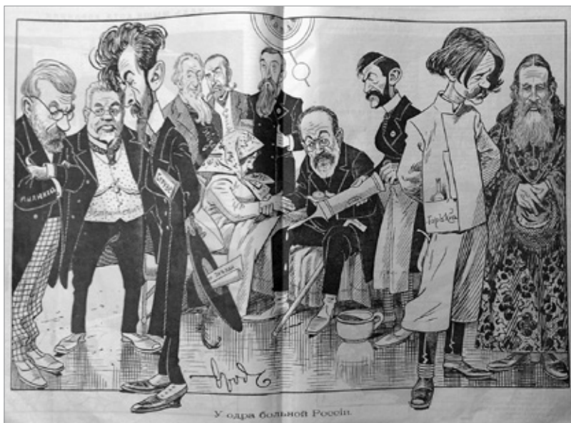
Рис. 6. Стрекоза. 1906. № 1. 14 янв. С. 8–9

Сатирики изображают Горького в зооморфном и растительном виде (Либрович 1903: 7), бесконечно тиражируют его привязанность к босякам ( Независимый 1917: 16) и простонародной одежде ( Развлечение 33 (1903): 1), утрируют пристрастие к алкоголю ( Штрихи и блестяшки 1903: 1) и «меняют» пол писателя ( Наше время 1 (1903): 8), заставляют рыться в мусоре «общественных отбросов» ( Будильник 9 (1904): 5). Среди всего многообразия карикатур большая часть довольно безобидна, но особо тревожные визуальные ноты звучат, когда сатирики фиксируют подталкивание Горьким России к революции. Здесь и насильная замена Горьким русского кокошника девицы-России санколотским красным колпаком ( Шут 486 (1905): 2–3), и принесение несчастной связанной страны в человеческую жертву, где Горький наравне с большевиками молится молуху революции ( Лукоморье 1917: 6–7). Россия тяжело больна, и знаменитый писатель, похоже, не знает способов ее излечения, печально поникнув главой в окружении многих политических и даже религиозных деятелей той эпохи ( Стрекоза 1 (1906): 8–9) (рис. 6).