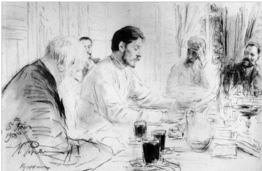
Рис. 2. И. Е. Репин. А. М. Горький читает в Пенатах свою пьесу «Дети солнца» (1905)

писателя изображен и Гарин-Михайловский ( Горький и художники 1964: 329).