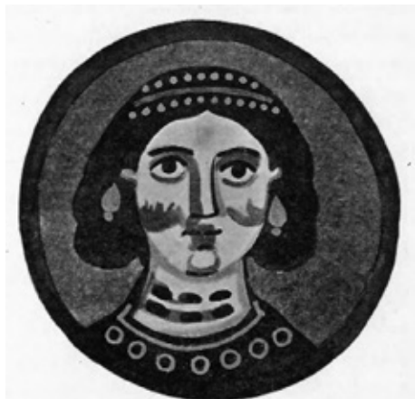
Сл. 3. Бавит, Капела III, представа врлине у медаљону, VI-VII век (СЛÉДАТ 1904, 23, fig. 18)