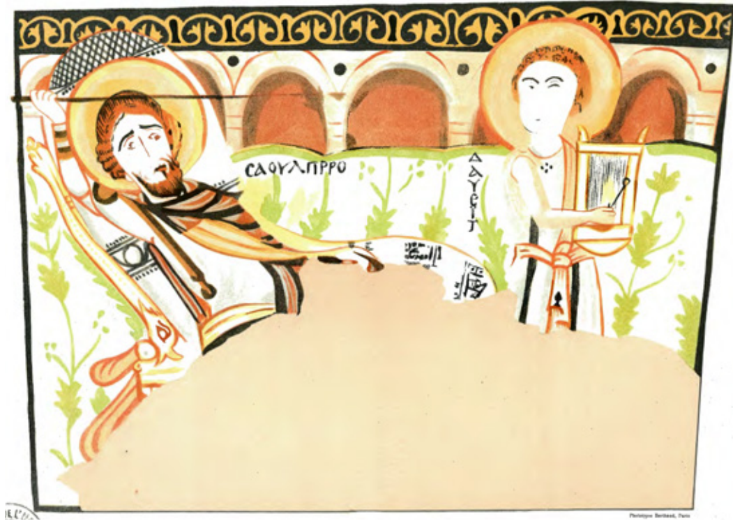
Сл. 1. Бавит, Капела III, Давид удара у њусле Саулу , VI-VII век (према: CLÉDAT 1904, pl. XVI)