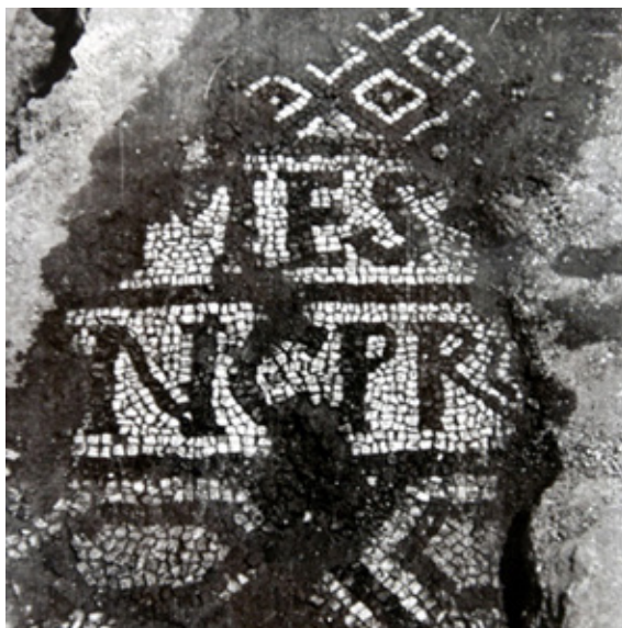
Сл. 3. Фрагмент подног мозаика из меморије на северној некрополи Улпијане

Подни мозаици са натписима откривени су и на северу централнобалканског простора, на локалитету Градиште код села Стојник на Космају. Реч је о оштећеном мозаичком тепиху откривеном на поду лонгитудиналне грађевине, која је била подељена на неколико мањих просторних јединица и на коју се ка истоку надовезивала