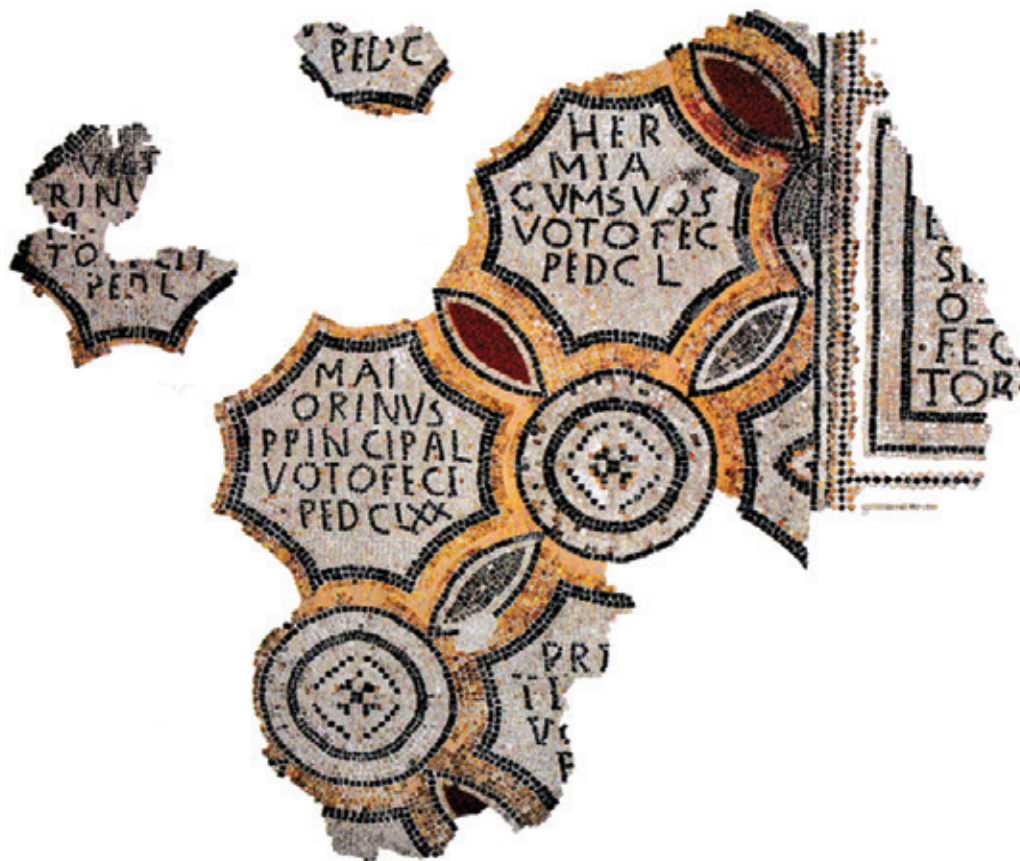
Сл. 4. Фрагмент мозаичког тепиха са пода грађевине на локалитету Градиште код села Стојник на Космају (према: ШПЕХАР 2019: 120, сл. 114)

ротонда у коју је, такође на истоку, била уписана широка апсида (ДУШАНИЋ 1974: 93–96; DUŠANIĆ 1976: 151–153; ФРАНКОВИЋ 2013: 300–302; ШПЕХАР 2019: 119–120; 2022: 48–49). Грађевина је датована у средину IV века, и премда се на данашњем нивоу истражености не може поуздано тврдити да је у питању хришћанска црква, њен просторни склоп веома је индикативан (ШПЕХАР 2019: 119–120; 2022: 48). Управо су вотивни подни мозаици ти који потврђују да је реч о веома важном објекту, доступном широј јавности. На овај закључак наводи пре свега карактер поменутог мозаичког тепиха, који је чинило неколико записа изведених вишебојним тесерама. Поља са натписима била су међусобно повезана геометријским орнаментима и укомпонована у јединствену целину на поду простора који је непосредно претходио улазу у ротонду. На њима се могу прочитати имена и звања дедиканата, као и број стопа мозаика које је свака од наведених особа поручила (сл. 4). Међу именима се може прочитати име