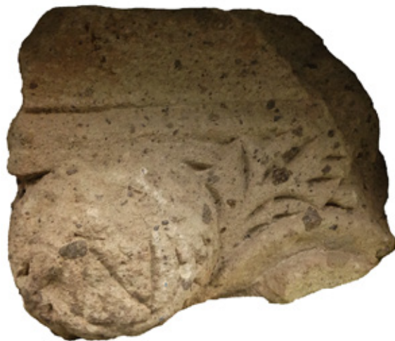
Сл. 5. Капител са монограмом цара Јустинијана I, Прва Јустинијана / Царичин град, VI век (према документацији Народног музеја Србије, инв. бр. 341/IV)