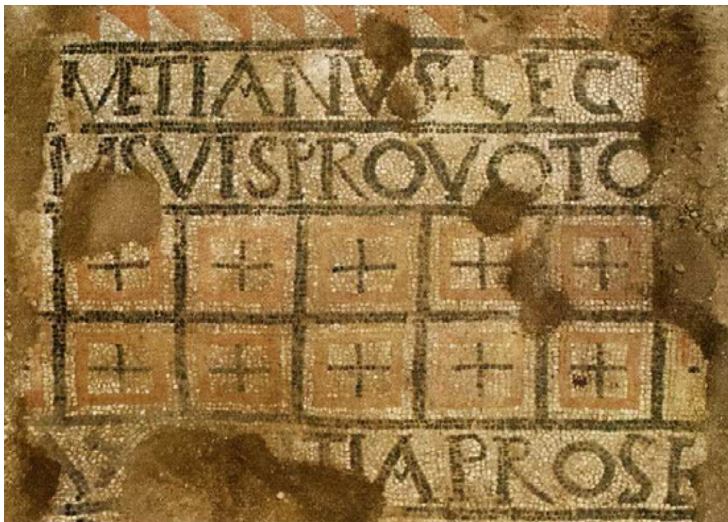
Сл. 2. Вотивни натпис са крстовима из тробродне базилике у Улпијани, IV век (према: ШЕТИНКАЈА 2015: 115, ph. 7)

важна искључиво у контексту могућег учешћа војске у градитељским подухватима од јавног значаја. Инсистирање на дедикантовом рангу у војној хијерархији сведочи да је реч о имућном високо позиционираном појединцу, који је своју приватну побожност исказао тиме што је дао да се на проминентном месту у цркви изradi вотивни мозаик, представљајући се на тај начин као један од њених приложника и, попут ранијих евергета, остављајући залог за будућа поколења оних који су се у њој молили.