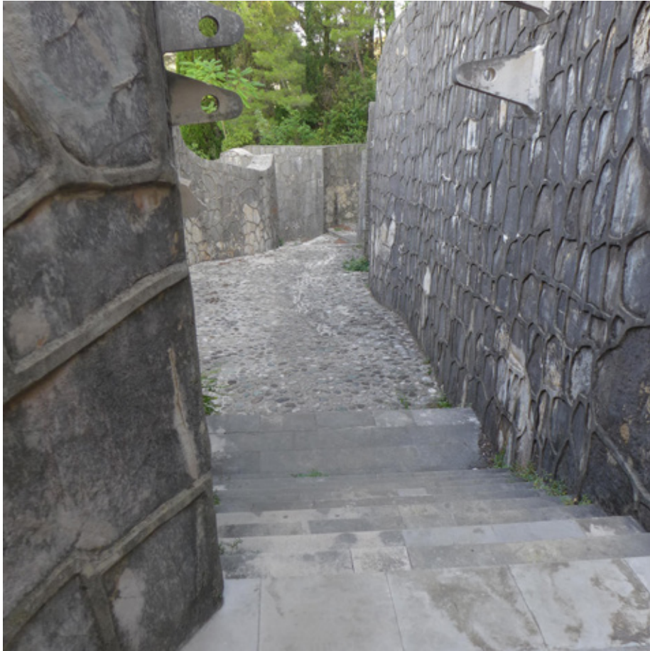
Сл. 3. Визуелна атмосфера некрополе

in the “crisis” (Krisis) and the “symptomatic” (symptomatisch) figure that surge with a “maximal degree of energy tension” (höchsten energetischen Anspannung) (DIDI-HUBERMAN 2000: 626–627).