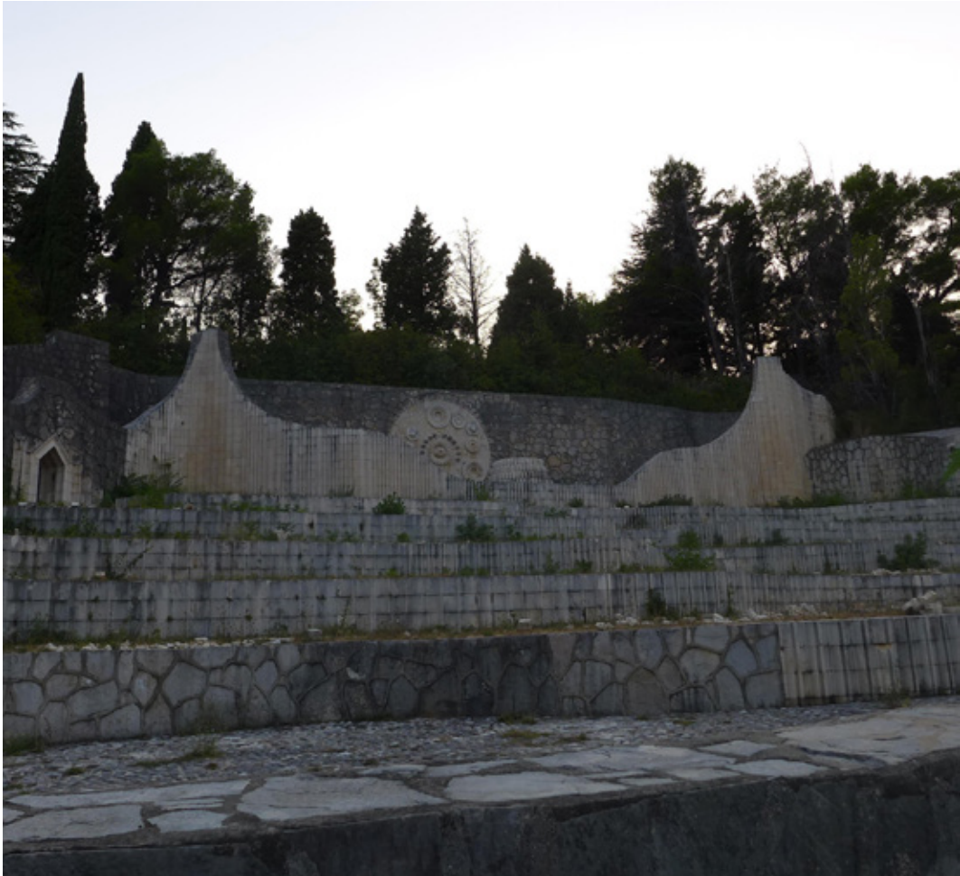
Сл. 2. Мостарски театрон

„отелотвореног споја временског и вечног, супстанција која гради идентитет човека као бића по средини – хероја као бића које посредује између трансценденције и иманенције” (Пилиповић 2010: 63).