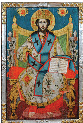
13. Непознати иконописац, Исус Христос (око 1750). Темпера на дасци, дуборез, позлата, посребрење, 100 × 66 cm Анализе: VIS, IR, EDXRF