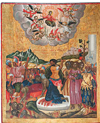
2. Мајстор Виктор, Усекованије десетџ криџских мученика (1694). Темпера на дасци, позлата, посребрење, 44,5 × 36,5 cm Анализе: VIS, UVF, IR, EDXRF