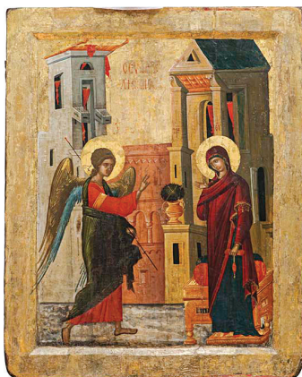
1. Непознати иконописац, Благовесџи (XVI век). Темпера на дасци, позлата, 71 × 57,5 cm Анализе: VIS, UVF, IR, OM, EDXRF