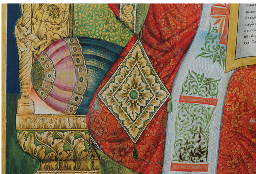
Сл. 11. Георгије Стојановић, Исус Христос (1737), детаљи коришћења злата и сребра, зграфито технике, сликања сребром и златом преко боје и пунцирањем.

на позлаћеним и посребреним деловима (оклопи на фигурама на иконама бр. 2 и 4, и делови одеће на икони бр. 9) као и сликање златом и сребром преко боје (иконе бр. 1, 3, 8, 11 и 13), али су врло честа и опонашања ових ефеката много скромнијим материјалима: аурипигмент уместо злата, или једноставна оловно бела и светли жути окер уместо сребра и злата, као и жути лак преко посребрене површине уместо позлате (иконе бр. 5, 6 и 12) (Сл. 8, 9). Од сликарских техника на испитиваним иконама заступљен је зграфито, и то код Станоја Поповића (бр. 11) на посребреној полираној подлози и Георгија Стојановића (бр. 8) на позлаћеној подлози, као и сликање сребрном и златном бојом, поред традиционалних белих тачака густе боје као бисера (Сл. 10, 11).