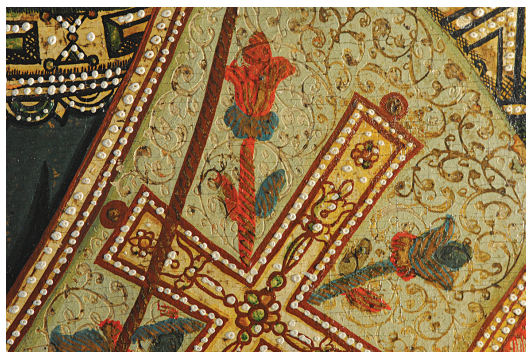
Сл. 10. Станоје Поповић, Исус Христос (1743), детаљ сакоса са богатом сликаном декорацијом.