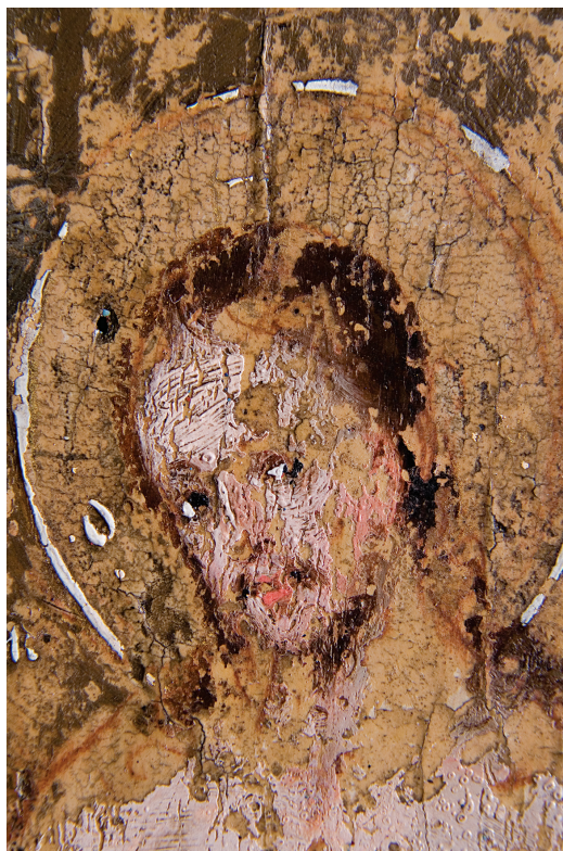
Сл. 6. Цртеж црвеним окером видљив на оштећењима бојеног слоја, фотографија у видљивом светлу.

препаратура светла, онда је услов рефлективности задовољен. Међутим, на традиционалним иконама често нема великих варијација у поставци ликова, па контуре у завршном слоју боје понављају линије цртежа, што отежава или потпуно онемогућује читање припремног цртежа на инфрацрвеној фотографији. Мале варијације се некада могу уочити и голим оком, као на позицији прстију на руци арханђела Гаврила који благосиља, на икони Благовести (бр. 1) из XVI века (Сл. 5).