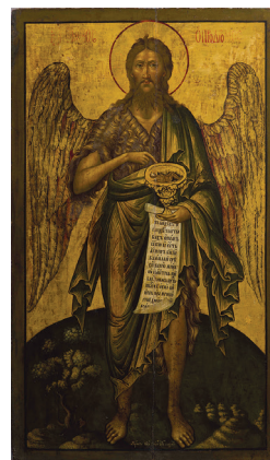
3. Јован Максимов, Свџџи Јован Преџџеча (1687). Темпера/уље на дасци, позлата, 118 × 71,3 cm Анализе: VIS, UVF, IRR, RX, OM, EDXRF