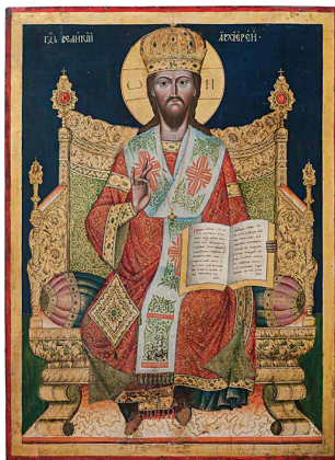
8. Георгије Стојановић, Исус Христос (1737). Темпера на дасци, позлата, 100 × 75 cm Анализе: VIS, IR, EDXRF