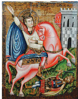
9. Христофор Жефаровић, Св. Димитрије (око 1740). Темпера на дасци, позлата, посребрење, 89 × 72 cm Анализе: VIS, IRR, UVR, OM, EDXRF