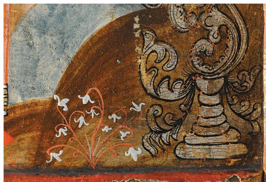
Сл. 9. Непознати иконописац, Благовести (прва четвртина XVIII века), детаљ посребрене површине стилизоване вазе и флоралног детаља.

релагар. Аурипигмент је минерал који у саставу има арсен, и бојом врло подсећа на злато, одатле долази и традиционално име. Од плавих, које су увек биле скупе и цењене, на испитиваним иконама није потврђен природни ултрамарин, већ азурит, индиго и пруско плава. Док су азурит и индиго традиционални пигменти са вековном применом у сликарству, пруско плава је први пигмент који се као производ органске синтезе појавио на сликарским палетама почетком XVIII века и врло брзо био прихваћен, што потврђују и анализе икона из колекције Галерије Матице српске. На испитиваним иконама из колекције Галерије Матице српске недостаје још један традиционални плави пигмент: смалт. Овај пигмент, добијен од млевеног плавог кобалтног стакла, идентификован је на иконама Деизисног реда (почетак XVI века) на иконостасу манастира Крушедола (Королија Црквењаков и др. 2012: 72). Од црних пигмената најчешћа је угљено црна. 7