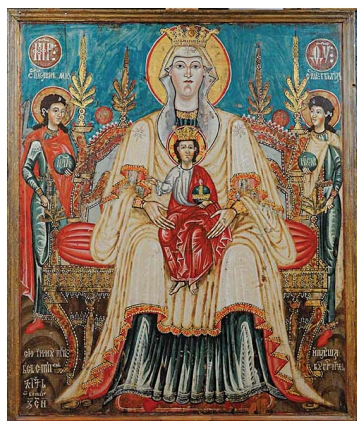
10. Непознати зограф, Богородица са дејијом (1742). Темпера на дасци, позлата, 95,5 × 80 cm Анализе: VIS, IRR, UVR, OM, EDXRF