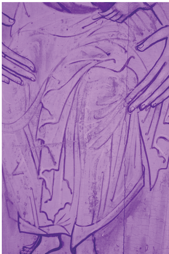
Сл. 7. Непознати иконописац, Бојородица са Христом (1742), инфрацрвена фотографија на којој се види припремни цртеж, детаљ.

Процес сликања подразумевао је припрему боја, које су сликари изводили у радионицама, мешајући пигменте у праху са одабраним везивом. Иако је уљано сликарство у западно-европској уметности дошло с периодом ренесансе, у иконописању какво је карактеристично за српске иконе традиционално је коришћена јајчана темпера. Међутим, како су везе, трговинске и културне, постојале непрекинуте са Западом, не може се искључити могућност да су сликари испробавали и друге комбинације везива. У утврђивању врсте везива, па и давању основне одреднице у опису неке слике: „темпера на дасци”, или „уље на дасци”, или „темпера и уље на дасци”, тешко је бити прецизан без детаљнијих испитивања која нису једноставна, и којих имамо најмање. Зато се оцене о сликарској техници још увек дају на основу карактера сликарског потеза и површине. Ово остаје отворено поље даљих истраживања – у ком периоду и како су српски сликари прешли са јајчане темпере на уљано везиво, увелико прихваћено од XVI века у европском сликарству.