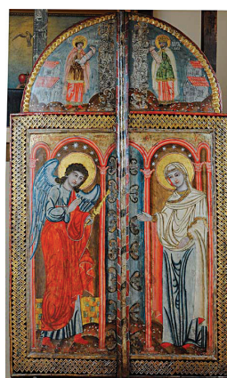
6. Непознати иконописац, Благовесџи (прва четвртина XVIII века). Темпера на дасци, позлата, посребрење, дуборез, 130 × 79 cm Анализе: VIS, IR, EDXRF