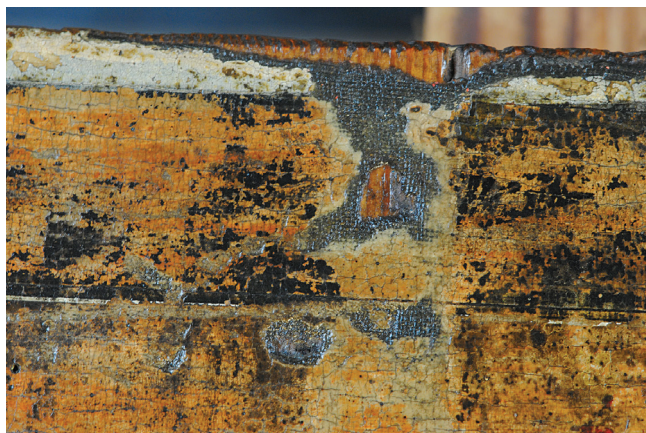
Сл. 3. Платно залепљено на даску, видљиво на оштећењу, на икони Христофора Жефаровића Св. Димитрије (око 1735). Платно је тамно јер је икона потапана у восак, услед чега боја сировог платна поприми много тамнији тон.