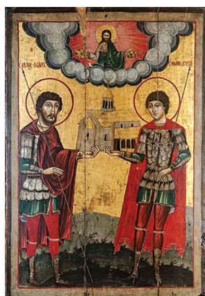
4. Непознати иконописац, Св. Теодор и Св. Тирон (око 1700). Темпера на дасци, позлата, 95,5 × 65 cm Анализе: VIS, UVR, IR, OM, EDXRF