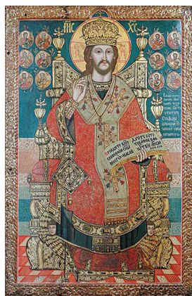
11. Станоје Поповић, Исус Христос са медаљонима њорока (1743). Темпера на дасци, дуборез, позлата, 124,5 × 82,5 cm Анализе: VIS, IR, EDXRF