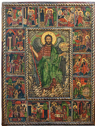
7. Станоје Поповић, Свети Јован са жијијем (прва четвртина XVIII века). Темпера на дасци, дуборез, позлата, 100 × 74 cm Анализе: VIS, IRR, UVR, OM, EDXRF