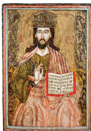
5. Непознати иконописац, Исус Христџос (прва четвртина XVIII века). Темпера на дасци, позлата, 68 × 48 cm Анализе: VIS, IR, EDXRF