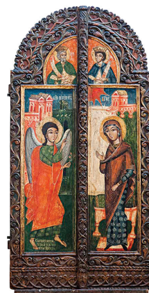
12. Непознати иконописац, Благовесџи (1740–1750). Темпера на дасци, позлата, дуборез, 148 × 76 cm Анализе: VIS, IR, EDXRF