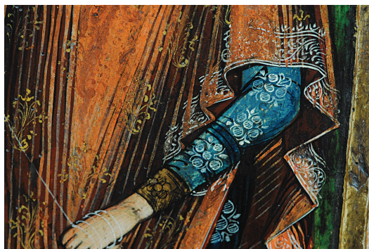
Сл. 8. Непознати иконописац, Благовести (1740–1750), детаљ са декорацијом на одори Богородице, изведеном белим и жутим пигментом.