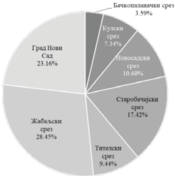
Графикон бр. 1. Табела „Лишење живота” према подацима из 1945. (по срезовима)

и „Немци у логорима ван Југославије” (20 односно 1,07%) и „Немци у земљи” (1 односно 0,05%). 36 Пописни резултати за Град Нови Сад нису сачувани, али смо их простим одузимањем реконструисали. Таквом методом дошли смо до закључка да је у Граду Новом Саду било 1.517 жртава, а починиоци злочина су били редом: „Мађари” (1.391 односно 91,69%), „Немци у логорима ван Југославије” (98 односно 6,46%), „Немци у земљи” (21 односно 1,38%) и „ушаше” 7 (0,46%). На графикану испод представљена је територијална расподела жртава у округу.