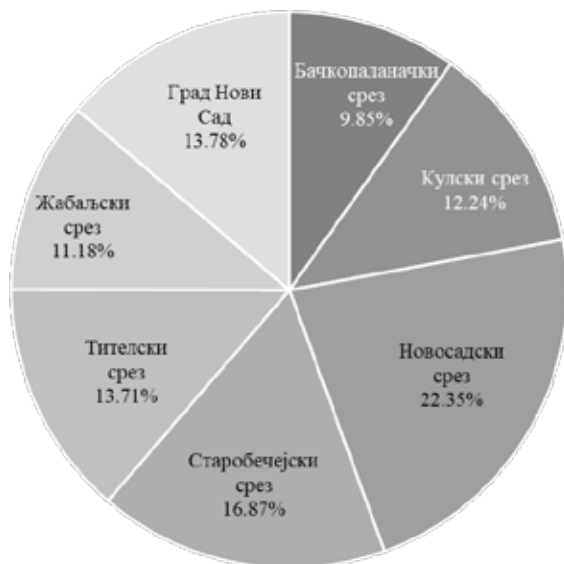
Графикон бр. 3. Табела „повреде личне слободе” према подацима из 1945. (по срезовима)

у окружној табели су као починиоци наведени „Мађари”, „Немци у земљи” и „ушаше” док се у среским табелама међу починиоцима налазе „Немци у логорима ван Југославије” (Бачкопаланачки и Старобечејски срез) и „Италијани” (Новосадски срез). Немамо логично објашњење за овакав диспаритет, осим евентуалне непажње пописивача. На Графикону број 3, у тексту испод представљена је територијална структура „повреда личне слободе”.