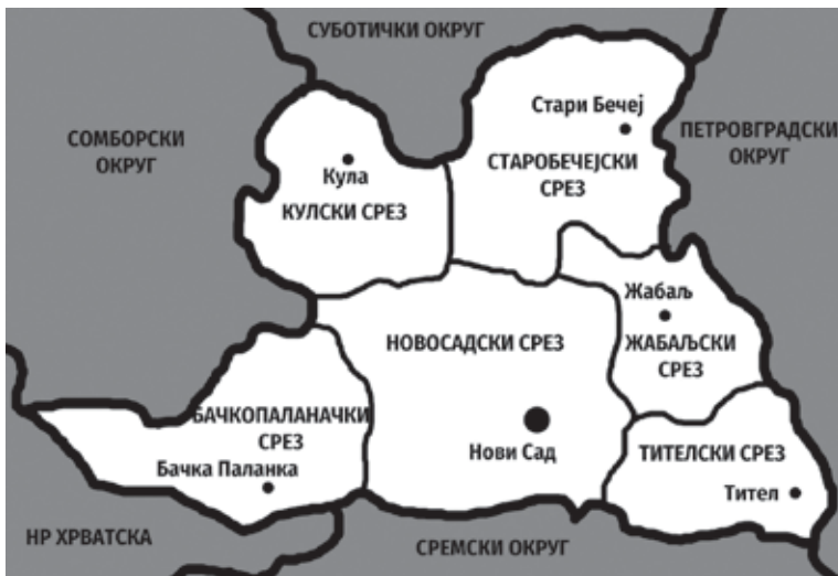
Карта бр. 1. Административна подела Новосадског округа 1945–1946. године

Након ослобођења Србије, крајем 1944. године, одлуком Антифашистичке скупштине народног ослобођења Србије, успостављена је нова административно-територијална подела која је била директни наставак територијалне поделе засноване на мрежи народноослободилачких одбора (сеоски, општински, градски, срески и окружни). Оваква, готово идентична територијална подела, озакоњена је првим послератним Законом о административној подели, који је донет 1. септембра 1945. године. Федерална Србија била је сачињена од 16 округа (Београдски, Ваљевски, Врањски, Крагујевачки, Крушевачки, Лесковачки, Моравски, Новопазарски, Нишки, Пиротски, Подрински, Пожаревачки, Тимочки, Топлички, Ужички и Чачански), подручја града Београда, Аутономне Покрајине Војводине и Аутономне Косовско-метохијске области. Према Закону о установљењу и устројству Аутономне Покрајине Војводине, који је такође донесен 1. септембра 1945. године, Војводина је подељена на шест округа: Новосадски (Нови Сад), Сремски (Сремска Митровица), Панчевачки (Панчево), Петровградски (Петровград), Сомборски (Сомбор) и Суботички (Суботица). Територија Новосадског округа била је подељена на шест срезова: Новосадски, Бачкопаланачки, Кулски, Старобечејски, Жабаљски и Тителски, као и подручје Града Новог Сада. Међутим,