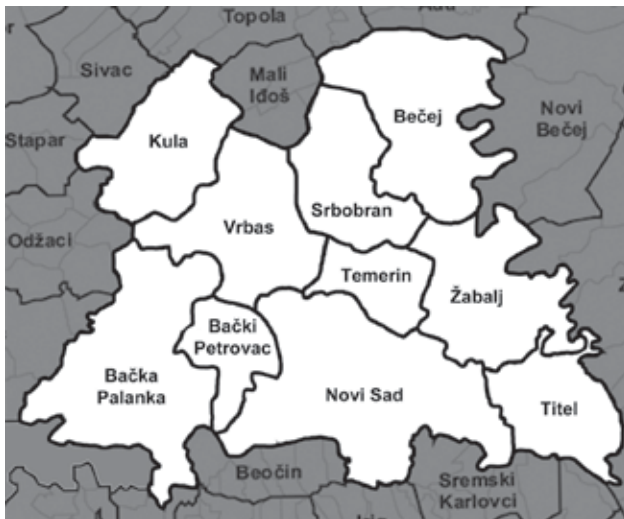
Карта бр. 2. Административна подела бившег простора Новосадског округа средином 60-их година XX века

Сврха пописа била је подношење одштетног захтева према тадашњој Савезној Републици Немачкој. Попис је суштински имао идеолошку компоненту, што ће се касније испоставити као његов најозбиљнији недостатак, пошто је одлучено да се не пописују лица која су „погинула у киселинским организацијама”. Пошто је број пописаних био далеко испод пријављених жртава рата Репарационе комисије (1.700.000), те да због тога попис није испунио своју првобитну намеру наплате ратне штете, на његово коришћење је стављена забрана и комплетан пописни материјал је дат на чување у Архив Југославије. Забрана је трајала до 1992. године, односно до распада југословенске државе. Од 1995. године Савезни завод за статистику је уз асистенцију Музеја жртава геноцида отпочео систематску ревизију пописа. Ова ревизија је подразумевала идентификацију нових жртава, најпре оних које са намером нису пописиване (колаборационисти, припадници немачке мањине), проверу постојећих података, брисање дуплих уноса, утврђивање починилаца злочина, утврђивање броја страдалих Рома и др. Ова ревизија је до 1998. обављана у Савезном заводу за статистику, а од 2003. године у Музеју жртава геноцида. Оваквом ревизијом број жртава је увећан за око 60.000. 57