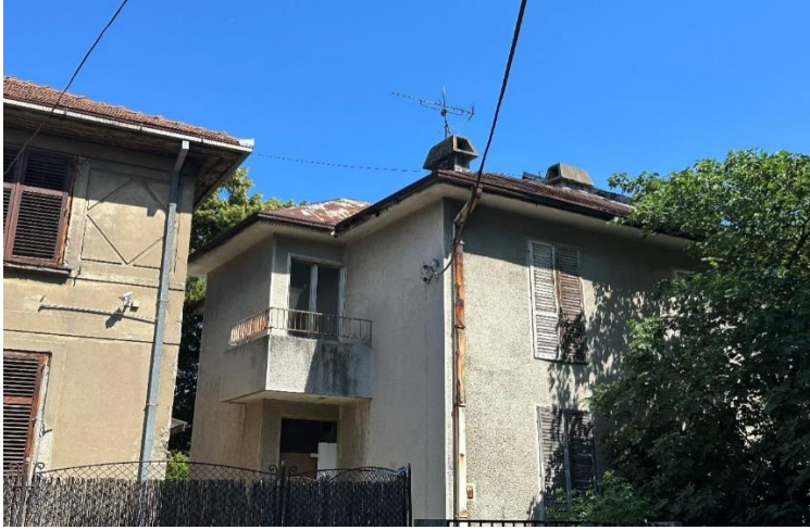
Слике 2,3 и 4. Данашњи изглед куће у Љубомира Стојановића 25, Београд