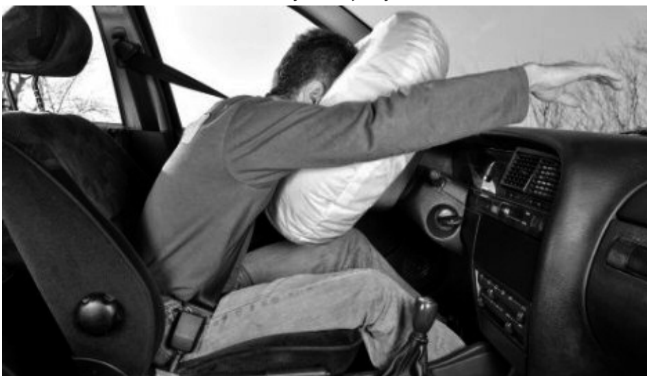
Слика 4: Положај возача при судару уз активирање сигурносног појаса и ваздушног јастука

седиште или путник, с обзиром на то да појас остаје блокиран, спречавајући њихово слободно кретање приликом судара. Најбољу заштитну улогу за возача и сувозача имају активни сигурносни појасеви који имају додатни затезач појаса, који се непосредно пре блокирања снажно затеже и приљубљује корисника уз наслон седишта, и уз јастуче за главу, обезбеђујући тиме да корисник буде што даље од ваздушног јастука у тренутку његовог активирања. Будући да сигурносни појасеви пружају највеће ефекте заштите у комбинацији са ваздушним јастуцима, у случају судара, односно незгоде, њихово активирање треба да буде синхронизовано. С тим у вези, бројна истраживања су изнедрила један од кључних ставова у погледу доприноса сигурносних појасева и ваздушних јастука заштити лица у возилу, а то је да ова два система морају да делују јединствено (синхронизовано), јер само тако представљају целовит и ефикасан систем заштите возача и путника у возилу у случају судара, односно саобраћајне незгоде.