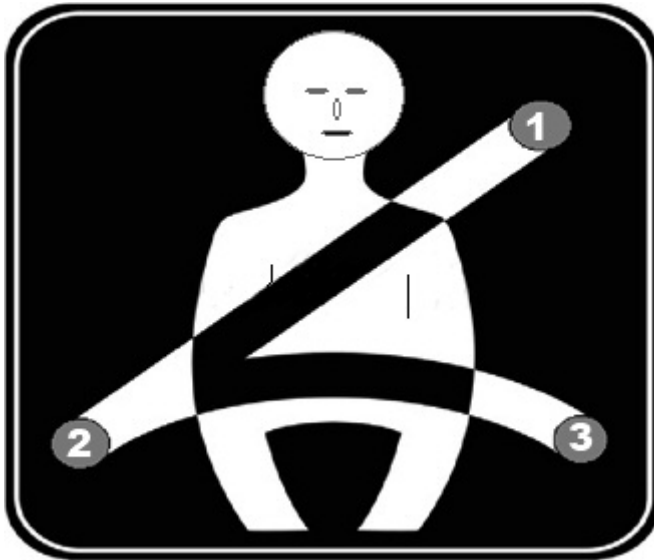
Слика 2: Три тачке ослонца (фиксирања) сигурносних појасева

У зависности од механизма који у критичној ситуацији врши блокирање појаса, разликују се: појас који се блокира у ситуацији опасној по корисника; појас са аутоматским блокирањем; комбиновани појас; појас који се отпушта ручно и активни сигурносни појасеви. Појасеви који се блокирају у ситуацији опасној по корисника највише се користе, имајући у виду да при уобичајеној вожњи не ограничавају покретљивост корисника појаса, због могућности за аутоматско попуштање и затезање појаса. У случају наглог успорења, односно судара, активира се механизам за блокирање појаса и спречава слободно кретање возача, односно путника, по инерцији. Овакви појасеви су погодни за причвршћивање дечијег седишта постављеног унапред, односно уназад, као и помоћног седишта за дете. Појасеви са аутоматским блокирањем