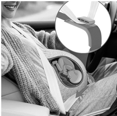
Слика 5: Препорука је да труднице обавезно користе сигурносне појасеве у возилу, по могућности са четири тачке ослонца, као на слици

У комбинацији са сигурносним појасевима, ваздушни јастуци имају додатну заштитну улогу за труднице у случају незгоде, али се препоручује да, због силине удара приликом надувавања, трудница седи што даље од предњег ваздушног јастука. Стандардни дизајн сигурносних појасева са три тачке ослонца, у одређеним ситуацијама може да изазове нелагодност код труднице и опасност за безбедност нерођеног детета. С тим у вези, у последње време све је више у примени иновативни дизајн сигурносних појасева за труднице са четири тачке ослонца. Овај појас пружа додатну заштиту трудници и нерођеном детету (фетусу) преко четврте тачке ослонца, тако што је појас причвршћен испод стомака труднице преко сигурносне копче и даље преко горњег дела бедара и карлице за друге две тачке ослонца (Слика 5).