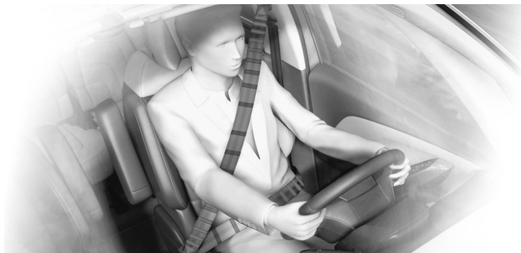
Слика 3: Активни сигурносни појасеви

Активни сигурносни појасеви све више се уграђују у савремене аутомобиле на предњим седиштима (за возача и сувозача). Ови појасеви имају сопствене моторе који затежу појас у случају опасности или наглог успорења. Када је возило у покрету ови појасеви оптималном силом притискају корисника (возача или сувозача) уз наслон седишта, пружајући му максималну заштиту у случају опасности, односно судара (Слика 3).