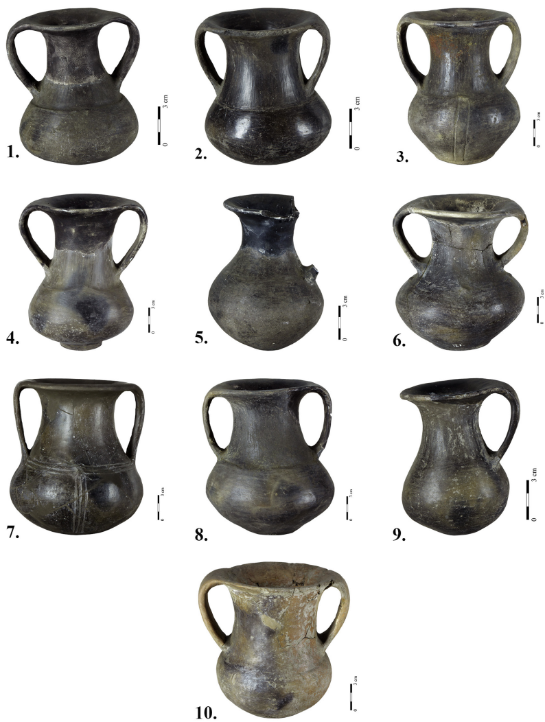
Т. I Пехари мокринског типа Pl. I Beakers of the Mokrin type