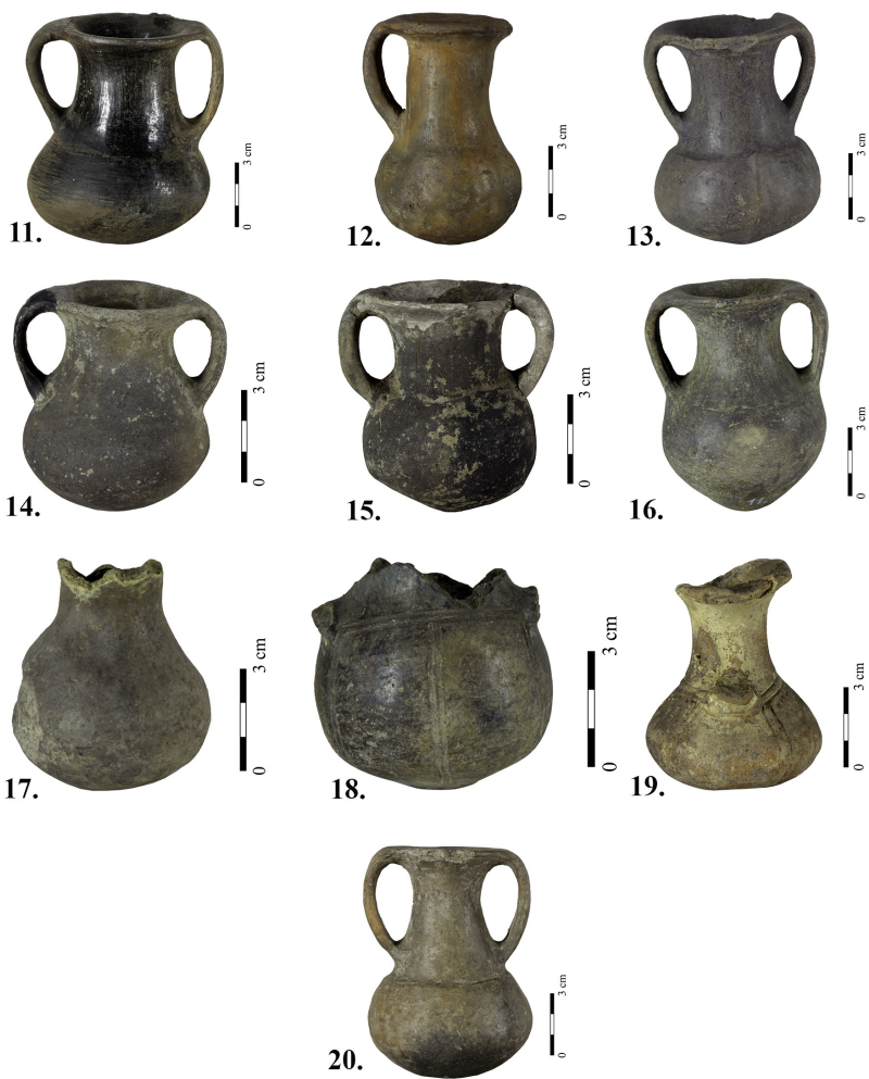
Т. II Пехари мокринског типа Pl. II Beakers of the Mokrin type