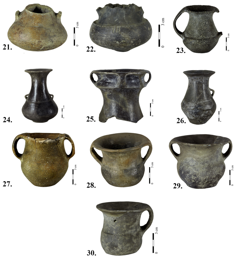
Т. III Пехари мокринског типа Pl. III Beakers of the Mokrin type