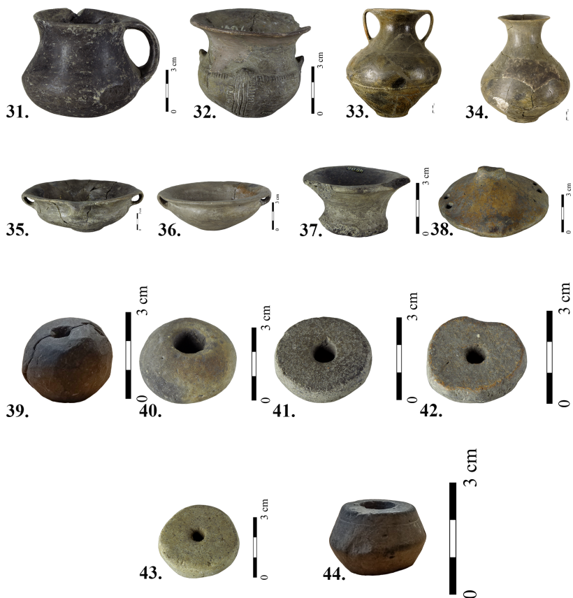
T. IV Пехари, амфороидне посуде, зделе, поклопац и пршљенци Pl. IV Beakers, amphora-shaped vessels, bowls, lid and whorls