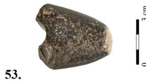
T. V Бакарни бодаж и камене секире/чекићи Pl. V Copper dagger and stone axes/hammers