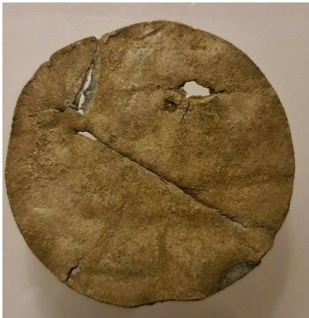
Сл. 2. Реверс оловне иконе тзв. култа подунавских коњаника у слободној продаји на интернету ( https://www.ebay.com/itm/193714849928 )