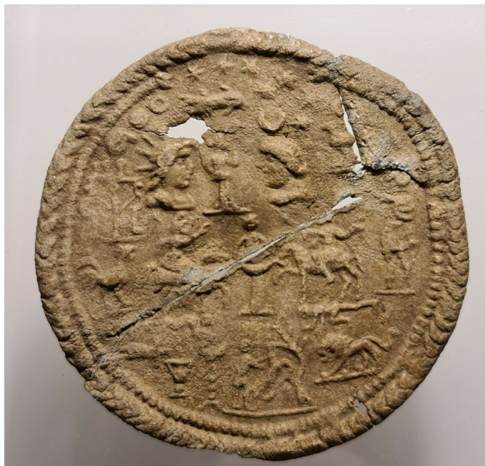
Сл. 1. Аверс оловне иконе тзв. култа подунавских коњаника у слободној продаји на интернету ( https://www.ebay.com/itm/193714849928 )