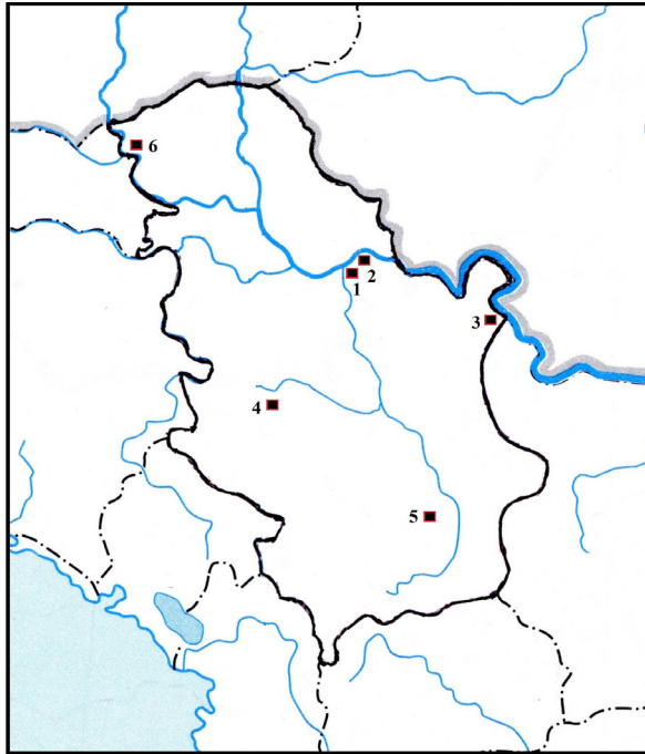
Сл. 2. Територијална распрострањеност језичака типа „Мартиновка” у данашњој Србији на основу досадашњих археолошких истраживања: 1. Маргум ( Margum ) – Орашје; 2. Стари Костолац – Тодића црква; 3. Прахово ( Aquae ); 4. Градина на Јелици; 5. Царичин град ( Justiniana Prima ); 6. Сонта (аутор карте: М. Миловановић)

Fig. 2. Territorial distribution of “Martinovka” type strap-ends in Serbia based on previous archaeological research: 1. Margum ( Margum ) – Orašje; 2. Stari Kostolac – Todića church; 3. Prahovo ( Aquae ); 4. Gradina on mount Jelica; 5. Caričin Grad ( Justiniana Prima ); 6. Sonta (author of the map: M. Milovanović)