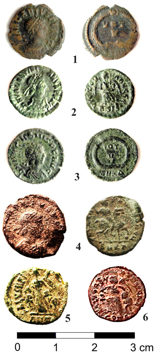
T. III Налази новца, остава на Укоси, 1) Новац Аркадија, 2) Новац Валентинијана II, 3) Новац Аркадија, 4) Новац Аркадија, 5) Новац са реверсном представом Spes Rei Pvblicae , ковница Антиохија, 6) Новац са реверсном представом Spes Rei Pvblicae , ковница Константинопољ