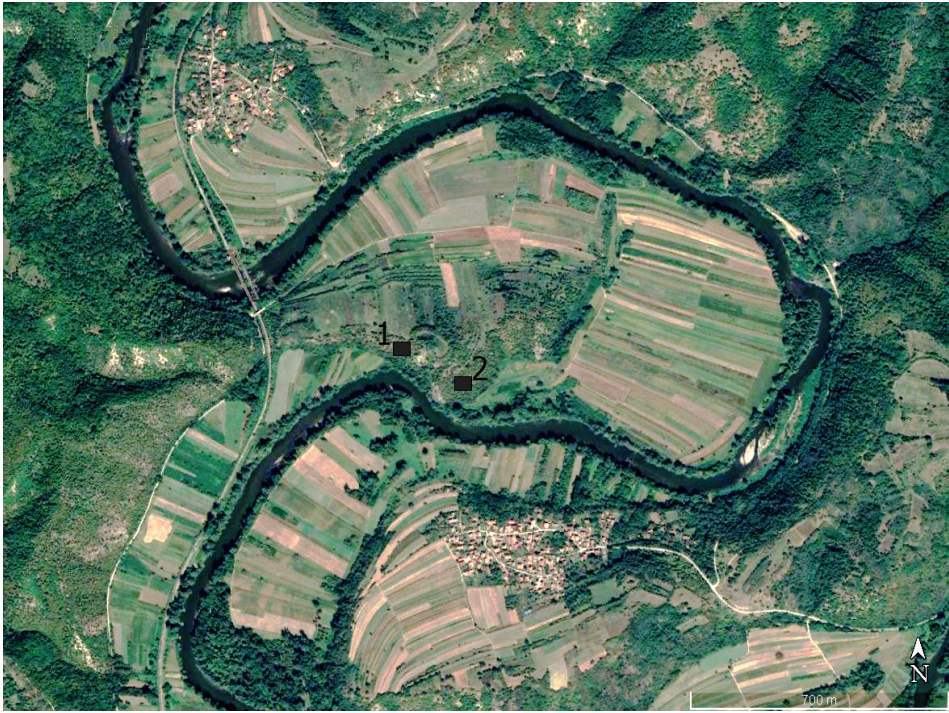
Сл. 1. Речно полуострво Јерининог града: 1) средњовековна утврда, 2) римско налазиште