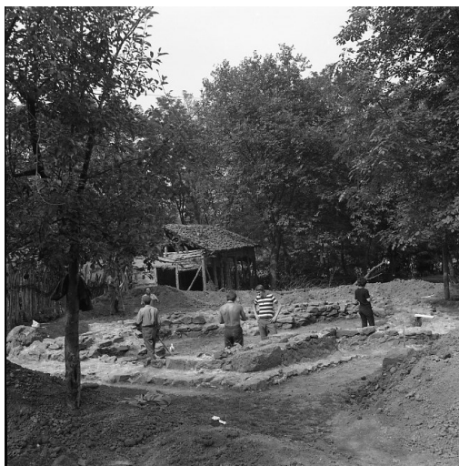
Сл. 12. Локалитет Црквина у Лаћиследу, остаци зидова цркве након археолошких истраживања (фотографија из 1972, Документација Завода за заштиту споменика културе Краљево)