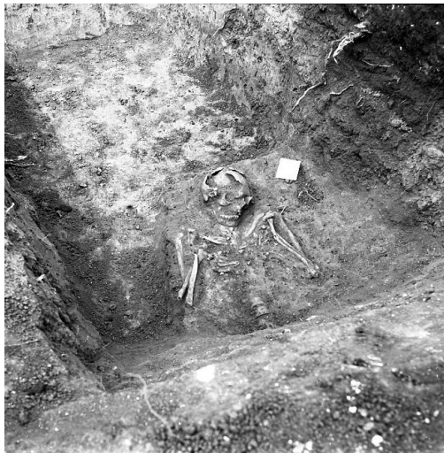
Сл. 9. Локалитет Црквина у Лаћиследу, један од делимично откопаних гробова (фотографија из 1972, Документација Завода за заштиту споменика културе Краљево)