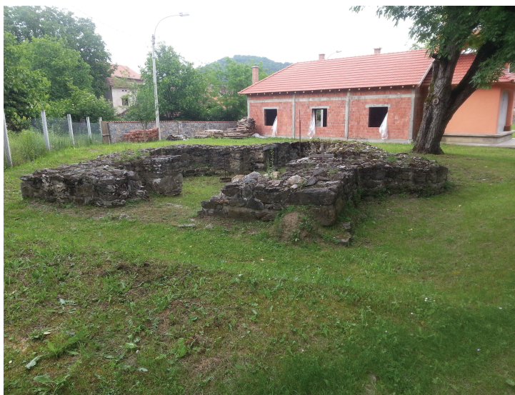
Сл. 13. Локалитет Црквина у Лаћиследу, остаци триконхалне цркве, поглед са југозапада – данашње стање