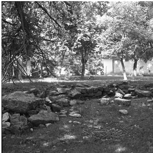
Сл. 3. Локалитет Црквина у Лаћиследу, затечени остаци цркве пре почетка археолошких истраживања 1972. године