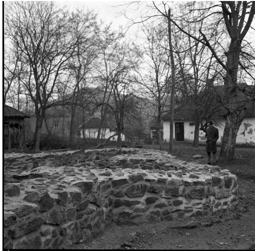
Сл. 16. Локалитет Црквина у Лаћиследу, спољашње лице зида јужне апсиде, након конзервације (фотографија из 1972, Документација Завода за заштиту споменика културе Краљево)