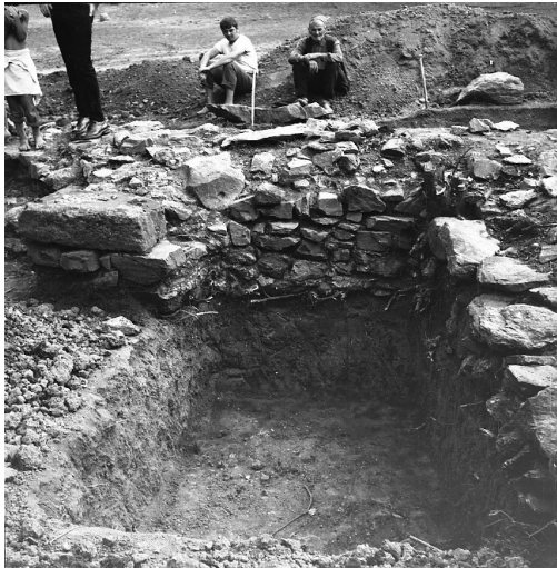
Сл. 6. Локалитет Црквина у Лаћиследу, археолошка сонда у јужној половини западног травеја наоса (фотографија из 1972, Документација Завода за заштиту споменика културе Краљево)