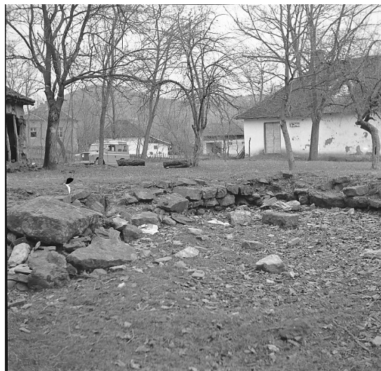
Сл. 5. Локалитет Црквина у Лаћиследу, пре почетка археолошких истраживања 1972. године