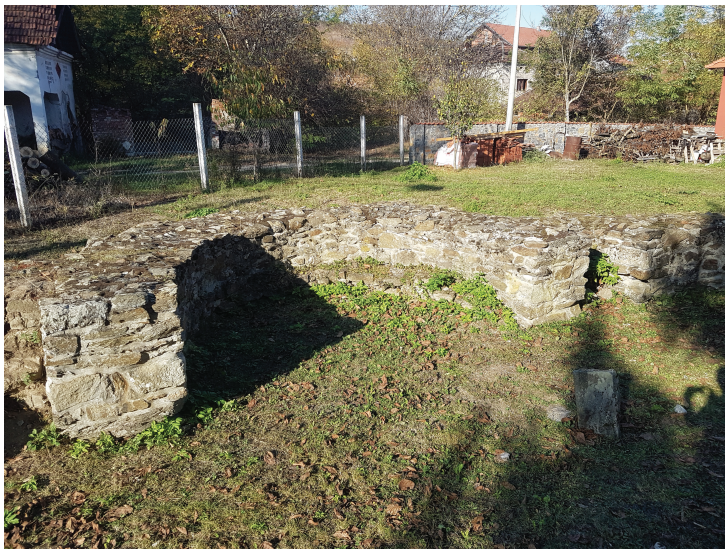
Сл. 17. Локалитет Црквина у Лаћиследу, унутрашње лице зида северне апсиде – данашње стање