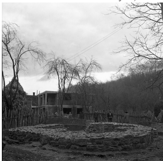
Сл. 15. Локалитет Црквина у Лаћиследу, остаци цркве након конзервације, поглед са истока (фотографија из 1972, Документација Завода за заштиту споменика културе Краљево)