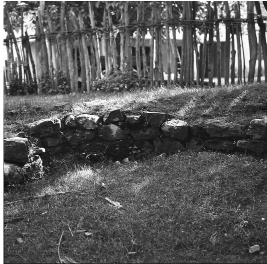
Сл. 4. Локалитет Црквина у Лаћиследу, део очуваног зида цркве пре почетка археолошких истраживања 1972. године