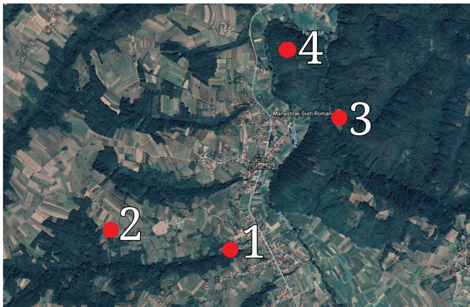
Сл. 1. Локалитет Црквина у Лаћиследу (Жупа александровачка) и друга археолошка налазишта у ближем окружењу: 1. Црквина, 2. Селиште, 3. Манастирак (Црква Светог Романа), 4. Милошев град (Градиште)