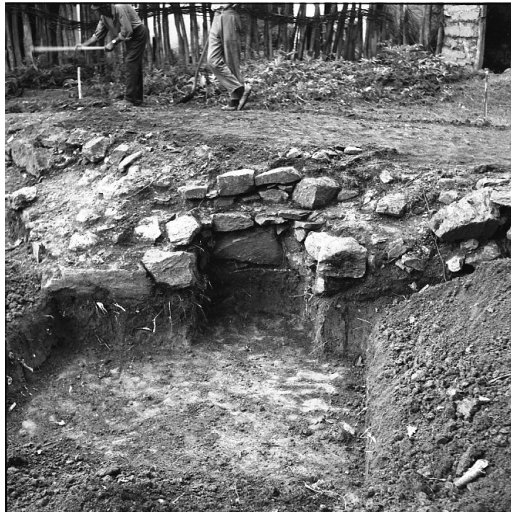
Сл. 7. Локалитет Црквина у Лаћиследу, археолошка сонда уз северни зид олтарске апсиде са нишом проскомидије (фотографија из 1972, Документација Завода за заштиту споменика културе Краљево)