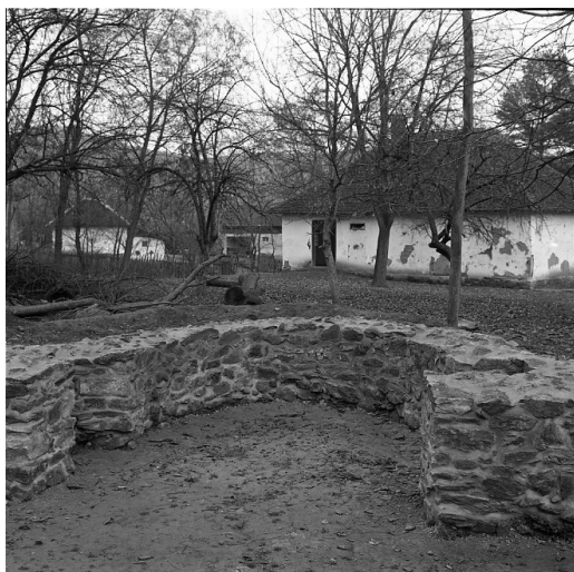
Сл. 14. Локалитет Црквина у Лаћиследу, олтарски простор цркве након конзервације зидова 1972. године