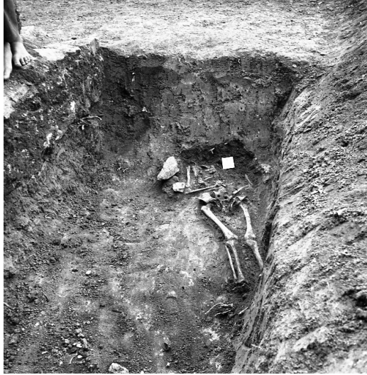
Сл. 10. Локалитет Црквина у Лаћиследу, делимично откопан гроб (фотографија из 1972, Документација Завода за заштиту споменика културе Краљево)