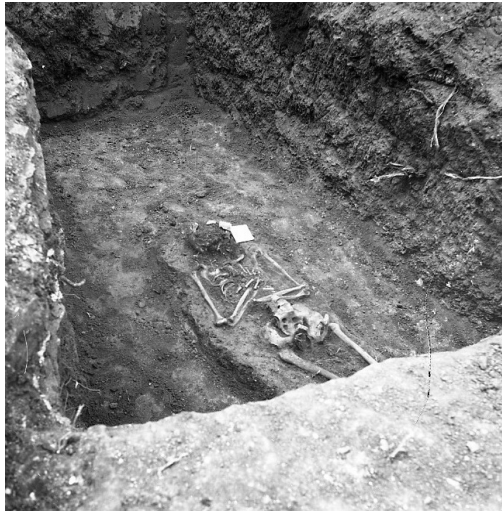
Сл. 8. Локалитет Црквина у Лаћиследу, делимично откопан гроб (фотографија из 1972, Документација Завода за заштиту споменика културе Краљево)