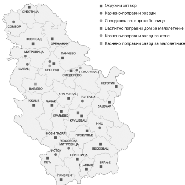
Установе за извршење кривичних санкција Републике Србије 15

Након казног завода на Топчидеру основан је казни завод у Пожаревцу 1865. а затим у Нишу 1878. Данас, Управа за извршење кривичних санкција Министарства правде Републике Србије у свом саставу има девет казно-поправних завода (Пожаревац–Забела, Сремска Митровица, Ниш, Сомбор, Београд–Падинска скела, Шабац и Ћуприја), 17 окружних затвора (Београд, Врање, Зајечар, Зрењанин, Крагујевац, Краљево, Крушевац, Лесковац, Неготин, Нови Пазар, Нови Сад, Панчево, Прокупље, Смедерево, Суботица, Ужице, Чачак), Казнено-поправни завод за малолетнике у Ваљеву, Казнено-поправни завод за жене у Пожаревцу, Специјална затворска болница затвореног типа у Београду и Васпитно-поправни дом за малолетнике полуотвореног типа у Крушевцу. 14