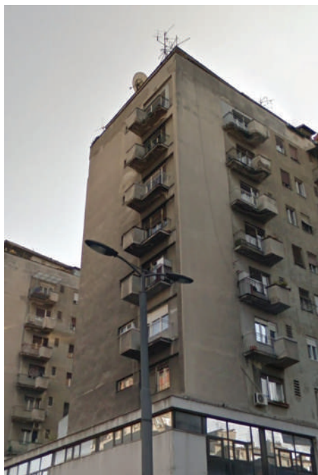
Branislav Marinković, Stambeni soliteri, Bulevar despota Stefana 66–68, 1957.

U prizemlju su pozicionirani lokali, garderobe osoblja, magacini, kancelarije, dvosoban stan za nastojnika zgrade, a po spratovima je 28 stanova, od kojih su posebno osmišljeni komforni trosobni stanovi sa dečjim sobama. Na povučenom osmom spratu Marinković je predvideo perionice, sušionice i toalet. Konstruktivni sistem sastoji se od armirano-betonskog skeleta sa ispunom od šuplje opeke, dok su međuspratne konstrukcije livene armirano-betonske. Pregradni zidovi su od šuplje opeke u kombinaciji sa cementnim malterom. Kao i na stambenoj zgradi na uglu Studentskog trga i Vasine, Marinković je posebno tretirao ulaze,