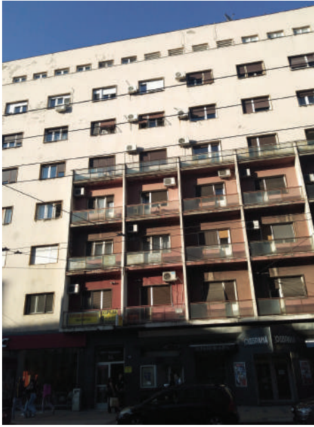
Branislav Marinković, Stambena zgrada, ugao Vasine ulice i Studentskog trga, 1952.