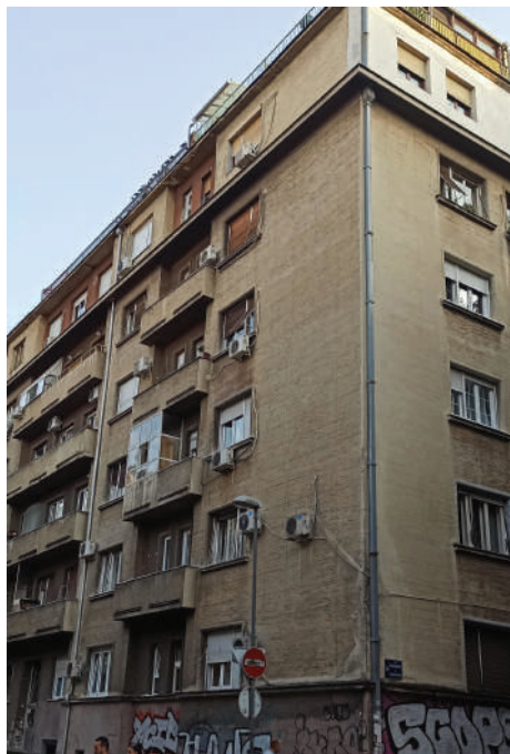
Branislav Marinković, Stambeni blok, ugao Gospodar Jovanove, Cara Uroša i Rige od Fere, 1949.

Njegovo poslednje ostvarenje u duhu socrealističke estetike predstavlja stambeni blok na uglu Gospodar Jovanove, Cara Uroša i Rige od Fere (1950). Nekadašnji neparni front Ulice cara Uroša s prizemnim i jednospratnim kućama ustupio je mesto savremenim stambenim objektima na oba ugla sa Gospodar Jovanovom ulicom, pa je tako Marinkovićev objekat