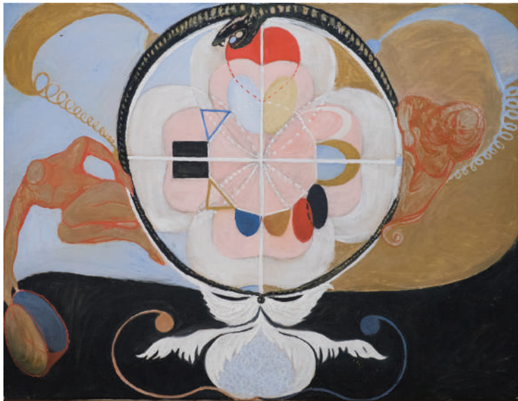
Hilma af Klint, Evolucija , br. 13, 1908

Osim Darvina, na učestalu upotrebu motiva puževe kućice u Hilminom slikarstvu mogla je da utiče i knjiga Umetnički oblici u prirodi ( Kunstformen der Natur ) nemačkog zoologa, filozofa i umetnika Ernsta Hekela (Ernst Haeckel) objavljena 1904. godine. (Loreck 2015, 40) U ovoj knjizi objavljeni su crteži fosilnih ostataka mnogih vrsta koje je naučnik istraživao, a koje su onovremenom čoveku pružile grafički prikaz drevnih oblika života i samim tim uvid u sličnosti i vezu savremenog sveta sa životom najstarijih vrsta koje su nastanjivale planetu. (Innes 2006) Pošto