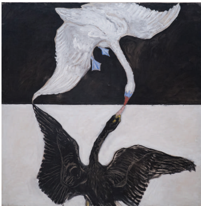
Hilma af Klint, Labud , br. 1, 1914–1915

kljun, što ga čini ženkom, dok je crni labud mužjak, što potvrđuju njegove žute noge i kljun. (Ryle 2019, 79) Na slikama koje slede dolazi do sukoba među labudovima praćenih multipliciranjem ravni u njihovoj pozadini i promenom boja kljunova i nogu životinja. (Ryle 2019, 80) Kako serijal slika odmiče, ptice ulaze u sve veći sukob, prilikom čega napuštaju svoju polovinu platna i gube prvobitnu distancu. U isto vreme muški i ženski princip se, prvo kroz borbu, a zatim kroz manje agresivan odnos nalik plesu, neminovno mešaju i već na slici Labud 4 obe ptice imaju po jednu žutu i jednu plavu nogu, a i njihova krila poprimaju boju perja suparnika. Na slikama Labud 6 i Labud 7 dolazi do umnožavanja labudova pa se umesto dve vide četiri ptice različitih nijansi mrke boje, što je rezultat prethodnog mešanja polova, njihovih boja, odlika i različitosti.