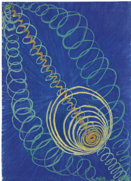
Hilma af Klint, Primordijalni haos , br. 16, 1906–1907, izvor: Wikimedia Commons, public domain

Jedna od velikih tema Hilminog apstraktnog slikarstva, koja jasno otkriva interesovanje autorke za svet prirode, jeste evolucija. (Voss 2016, 24) Teorija evolucije Čarlsa Darvina (Charles Darwin), objavljena 1859. godine u knjizi О проислу врста ( On the Origin of Species ) uzdrmala je ne samo naučni već i umetnički