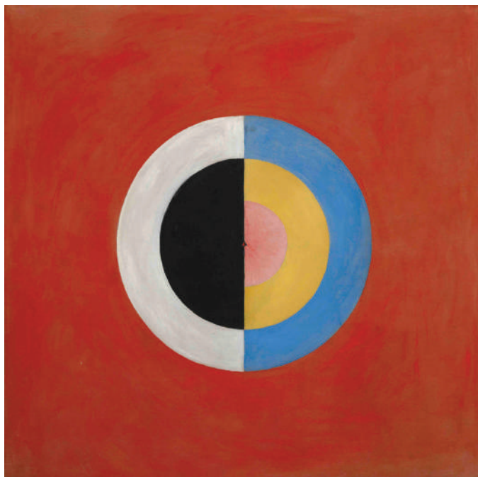
Hilma af Klint, Labud , br. 17, 1915

se ograničenja i razlike materijalnog sveta poništavaju zahvaljujući prevazilaženju dualiteta, pomirenju polova i njihovom spajanju u jedinstveno superiorno biće.