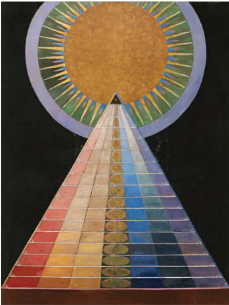
Hilma af Klint, Oltarska slika , br. 1, 1915, izvor: Wikimedia Commons, public domain

Mali broj bliskih Hilminih prijatelja imao je priliku da tokom umetničkog života vidi njene nefiguradne radove. Jedan od njih bio je upravo Rudolf Štajner, koji je 1908. godine poslovno posetio Stokholm i tom prilikom je upoznao Hilmu af Klint koja ga je pozvala u atelje u želji da mu pokaže svoja inovativna dela. (Leon 2020, 8) Posmatrajući njene rane apstraktne radove Štajner je izjavio da čovečanstvo još uvek nije spremno za takvu vrstu umetnosti i da neće biti u narednih pola veka. (Ryle 2019, 77) Moguće je da je svojom izjavom