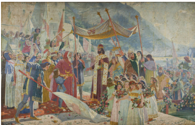
Marko Murat, Ulazak cara Dušana u Dubrovnik , 1900, ulje na platnu, Narodni muzej u Beogradu

Spoj tradicionalne teme i modernog načina slikanja, osim kod Murata, uočava se i na slici Paje Jovanovića Krunisanje cara Dušana , koja je takođe izlagana u paviljonu Kraljevine Srbije. Pored velikog broja prikazanih ličnosti, što je vernije bilo moguće, imajući u vidu da su oba slikara u svom radu objedinila kako učenja romantičarski orijentisanog sagledavanja prošlosti, tako i kritičko tumačenje istorije, samim tim i njenog vizuelnog predstavljanja, obe slike su urađene u duhu plenerizma, sa posebnim naglaskom na jako dnevno osvetljenje koje dominira na ovim monumentalnim platnima. S obzirom na to da su obe slike rađene sa namerom da budu izložene na Svetskoj izložbi u Parizu, kao logičan zaključak nameće se činjenica da su Marko Murat i Paja Jovanović, slikajući na ovaj način, želeli da pokažu kako se uticaj glavnih tokova modernog evropskog slikarstva može videti na delima koja reprezentuju jednu mladu, skoro proglašenu kraljevinu. (Merenik 2018, 88) Ove dve monumentalne istorijske kompozicije, već tada dva velika slikara, ubrajaju se u prva srpska dela na kojima je vidljiv uticaj dnevnog, prirodnog osvetljenja.