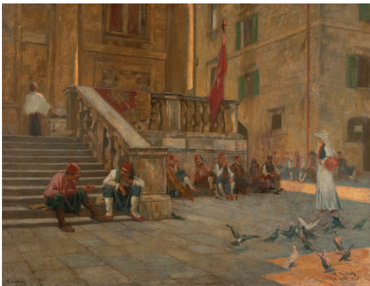
Marko Murat, Pred crkvom Sv. Vlaha , 1896, ulje na platnu, Narodni muzej u Beogradu

uspešno spaja i objedinjuje nov i moderan način slikanja sa žanr-tematikom koja se „odigrava” na istorijskoj pozornici. Veći broj Dubrovčana sedi ispred pročelja glavne gradske crkve Svetog Vlaha u lokalnoj odeći, odmarajući se i pričajući. Predstava devojke u beloj haljini, sa korpom u ruci, prikazana je na desnoj strani slike, dok je kraj njenih nogu jato golubova. Preko puta crkve vidimo tipičnu dubrovačku kuću sa otvorenim, zelenim škurama. Blagi i diskretni sunčevi zraci padaju na tlo, dubrovački Stradun, i stvaraju igru svetlosti i senke na slici. Pred crkvom Sv. Vlaha , možemo tumačiti i u kontekstu već spominjanih struktura vremena dugog trajanja u delu Fernana Brodela. Stari grad Dubrovnik se sagledava kao glavni topos istočnog Jadrana i kao reminiscencija idealizovane slike bolje prošlosti i koncepta vizualizacije zlatnog doba. (Borozan 2015, 205)