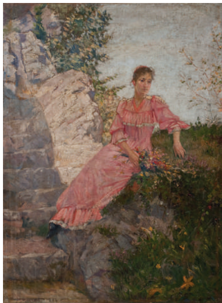
Marko Murat, Proleće , 1894, ulje na platnu, Narodni muzej u Beogradu