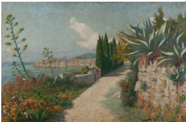
Marko Murat, Dubrovnik , 1908, ulje na platnu, Narodni muzej u Beogradu

Mediterana po vegetaciji, svetlosti, otvorenim vizurama i prikazima morske površine. (Šuica 2014, 657) Dubrovnik, jedan od najvažnijih mediteranskih gradova u istoriji srednjeg i novog veka, sagledava se kroz prizmu arkadijski definisanog predela u kome je zauvek sačuvano zlatno doba prošlosti. Murat, sklon melanholičnom i nostalgičnom raspoloženju, svoj rodni kraj vidi kao idealan motiv u koji učitava svoje misli i osećanja, ali ujedno i slavi njegovu veličajnost, što naročito ističe jakim sunčevim zracima koji obasjavaju grad i more. Osećaj bezbrižnosti i spokoja, ali i melanholije i nostalgije, na najbolji način opisuje osećaj koji dubrovački pejzaži izazivaju u posmatraču. Na ovo upućuju i reči Milana Predića: