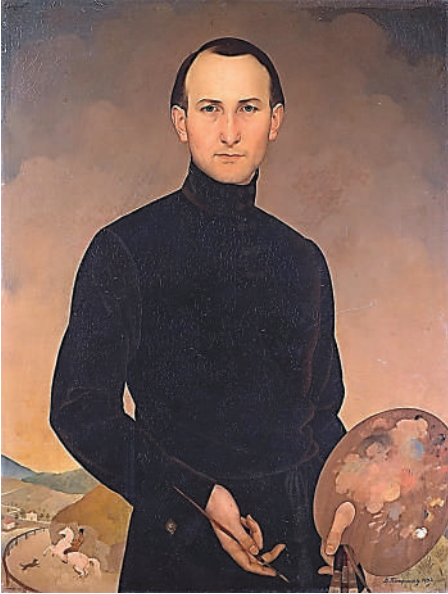
Vasa Pomorišac, Autoportret , 1932, ulje na platnu, 102 X 70 cm, Galeija Matice srpske, Novi Sad

prihvatanje ideja pompjerizma u likovnim umetnostima. 6 Parisov sud je slika koja potvrđuje moć Pomorišca da istovremeno bude i krajnje renesansno tradicionalan i da, u svom tadašnjem okruženju srpskog kubističko-ekspresionističkog slikarstva, bude moderno-avangardan u svojim hronološko-estetičkim antagonizmima.