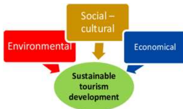
Slika 3: Prikaz činilaca održivog turizma

Slika 3 pokazuje podsisteme koji čine održivi turizam a iz nje se vidi koliko u svojoj suštini ekoturizam i na ovaj način veoma liči na zamisao koncepta održivog razvoja.