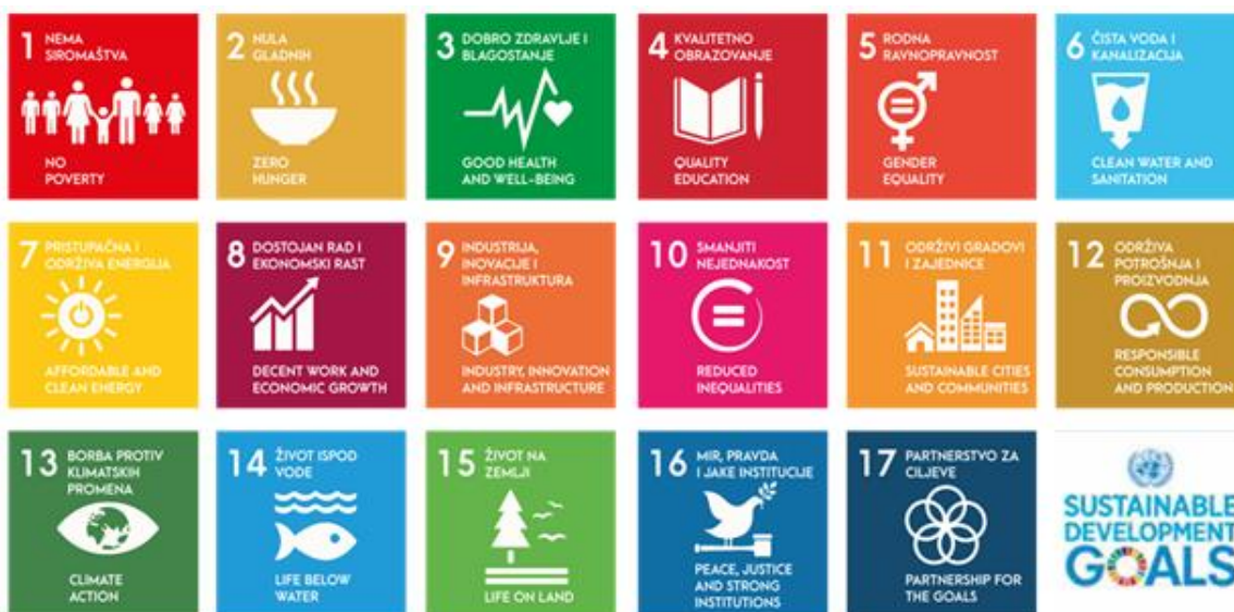
Slika 1. Ciljevi održivog razvoja