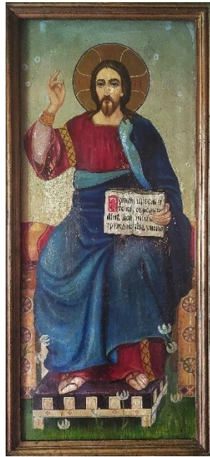
5. Исус Христос, Андреј Биценко, 3. или 4. деценија XX века