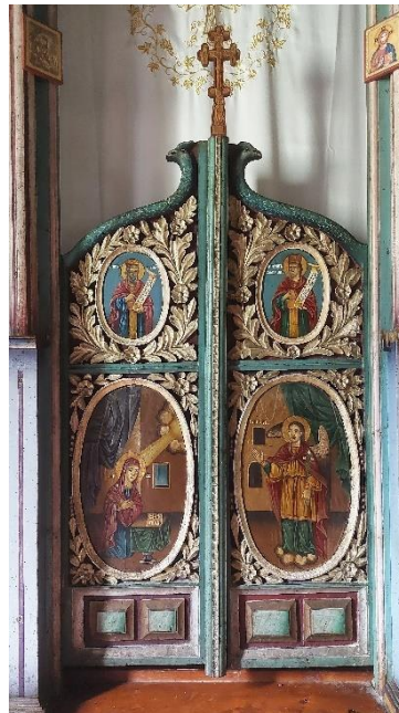
2. Царске двери, Евстатије Поп Димитров, 1904.