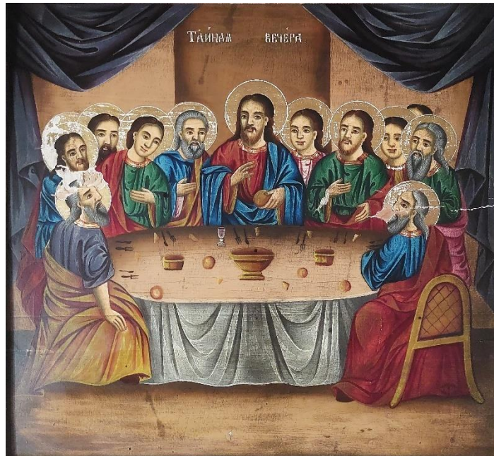
6. Тајна вечера, Евстатије Поп Димитров, 1904.