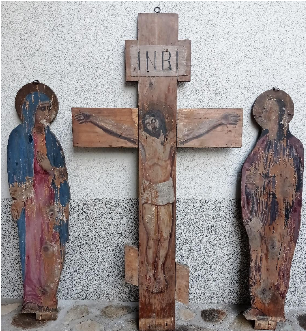
9. Запрестони крст, Андреј Биценко, 3. или 4. деценија XX века