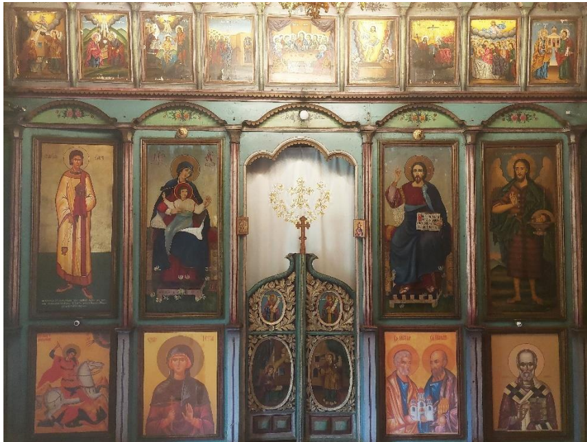
1. Иконостас у цркви Светог Георгија, манастир Ајдановац