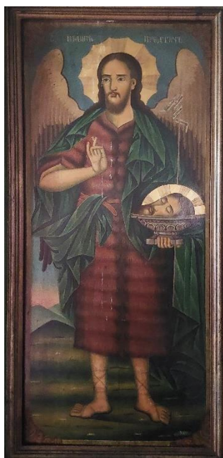
4. Свети Јован Претеча, Евстатије Поп Димитров, 1904.