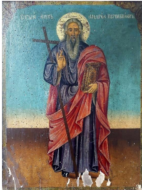
7. Свети Андреја Првозвани, Евстатије Поп Димитров, 1904.