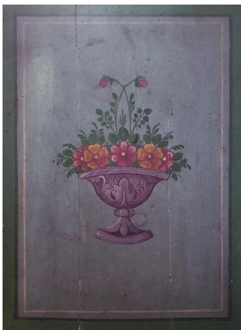
3. Унутрашња страна сокла, Евстатије Поп Димитров, 1904.