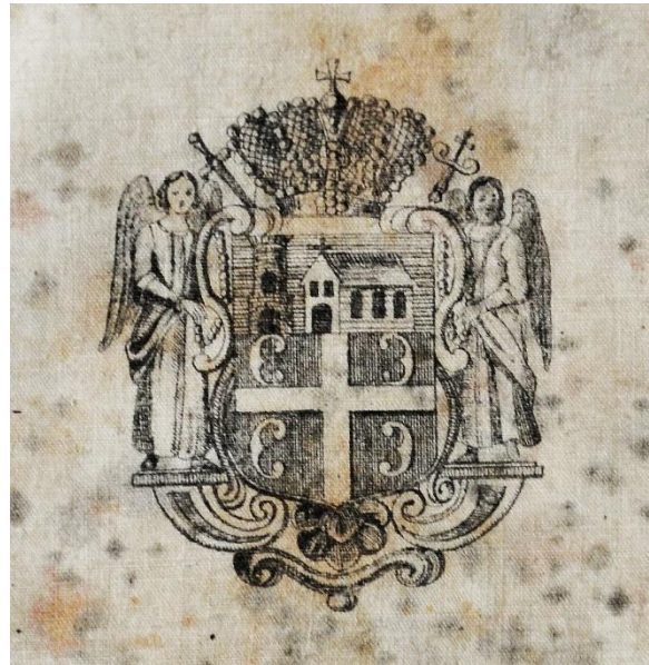
6. Грб Карловачке митрополије, детаљ антиминос Анастаса Јовановића. 6. Coat of Arms of the Metropolitanate of Karlovci, detail of Anastas Jovanović's antimension.