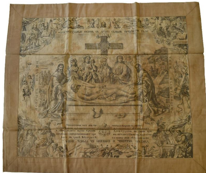
7. Антиминс штампан према предлошку Георга Николаја и Анастаса Јовановића освећан од стране митрополита Димитрија у Београду 1911. године. 7. Antimension based on the model of Georg Nikolaj and Anastas Jovanović, consecrated by Metropolitan Dimitrije in Belgrade in 1911