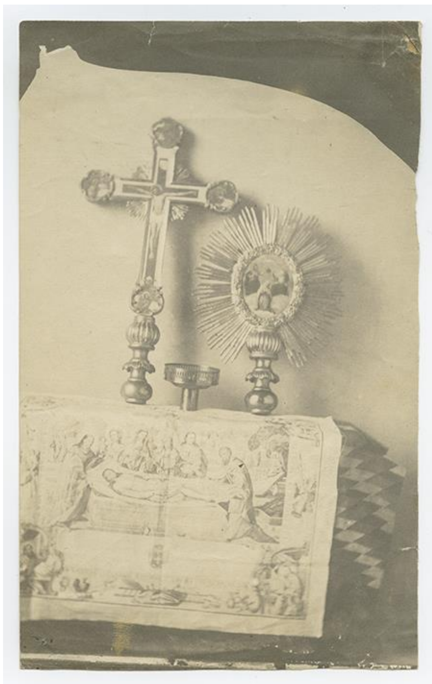
1. Фотографија Анастаса Јовановића позната као „Црквене утвари“, настала половином 19. века. 1. Photograph taken by Anastas Jovanović known as "Church Utensils" dating from the middle of the 19th century.