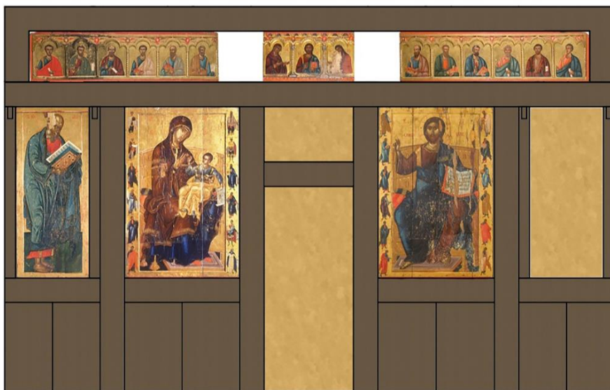
Сл. 7. Реконструкција сопоћанског иконостаса са иконама (Исидора Кисин, Урош Марковић)