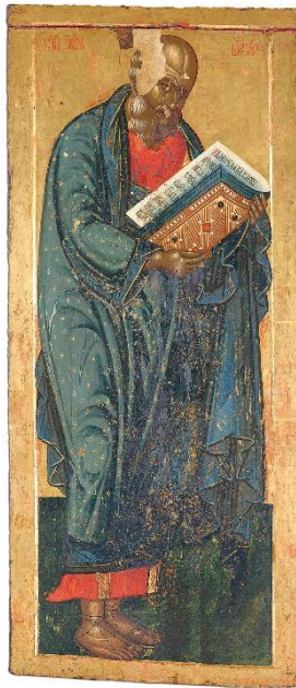
Сл. 3. Свети Јован Богослов