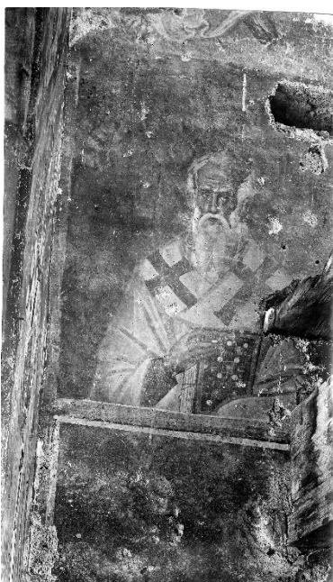
Сл. 5. Сопоћани, олтар, остаци носећих греда иконостаса, 1926.г.