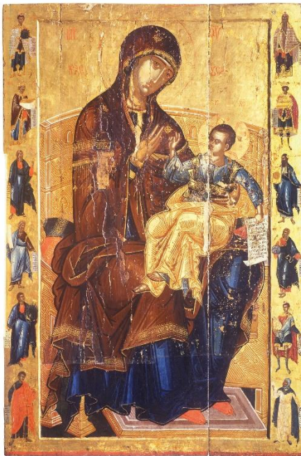
Сл. 2. Богородица Елеуса