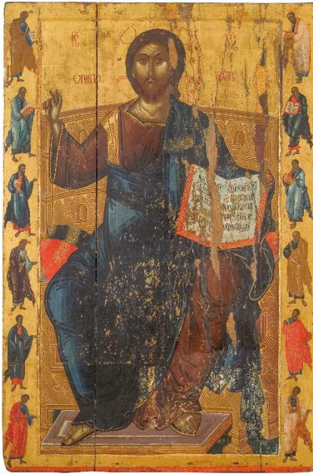
Сл. 1. Христос Пантократор