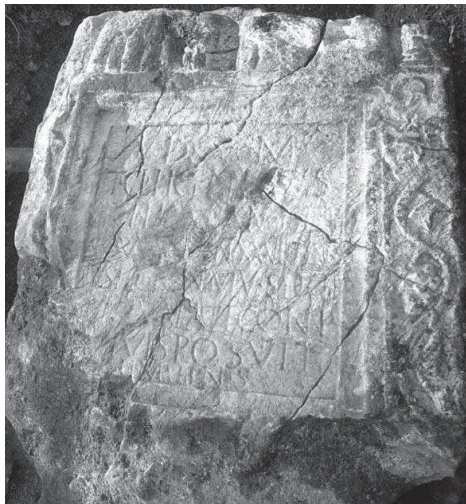
Сл. 9. Натписно поље

Због физичког оштећења натписног поља, реконструкција текста уклесаног на натпису је доста несигурна. Јасно је да се у првом реду