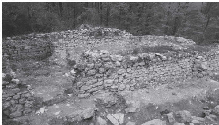
Сл. 2. Поглед на базилику са јужним и западним бродом

Међутим, услед недостатка материјалних средстава истраживања су прекинута. Резултати тих истраживања нису објављени и стављени на увид стручној јавности.