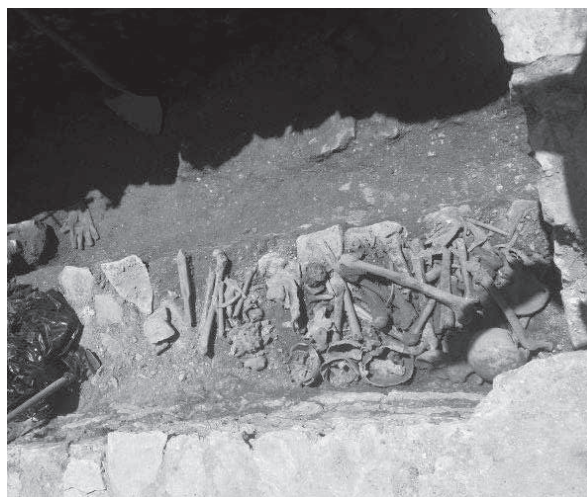
Сл. 5. Остаци скелета пронађени унутар гробнице

По свему судећи, две грађевине приближно кружног облика које се налазе у близини базилике, а још увек су неистражене, највероватније представљају ранохришћанске гробнице на свод. Наиме, постојање гробница на свод унутар, али и у непосредној близини ранохришћанских базилика веома је честа појава на простору римске провинције Далмације. 28 То се објашњава чињеницом да су хришћани касне антике преферирали да се сахрањују поред места где су сахрањени хришћански мученици. 29 На исти начин се може објаснити присуство више особа у гробници. Затечене разбацане кости наводе на претпоставку да је гробница још раније отворана, односно да су вршени каснији упоки. 30