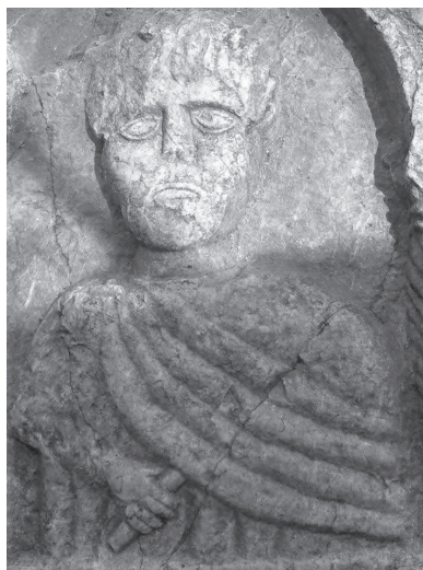
Сл. 8. Приказ мушке особе у горњој ниши

Квадратично натписно поље има украшен профилирани оквир са вегетативним мотивима. Натпис је био уклесан у осам редова. Средишњи дио натписног поља, услед дјеловања људског фактора је