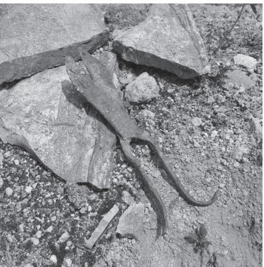
Сл. 6. Један од пронађених артефаката

тву, ипак можемо доћи до неког временског оквира у коме је настала базилика која је тема овог рада.