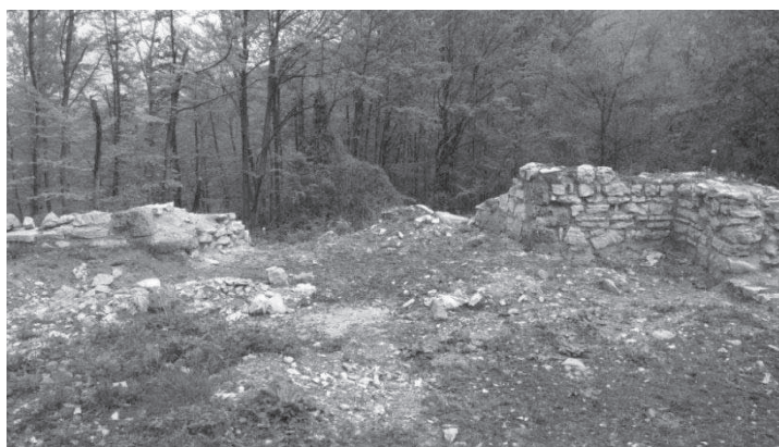
Сл. 3. Олтарски део базилике

Такође, нису обављени конзерваторски радови, што за резултат има пропадање базилике. Циљ овог рада јесте да се широј стручној јавности прикажу резултати досадашњих истраживања и подстакну нова археолошка ископавања, која ће нам омогућити да стекнемо бољу представу о овом, до сада непознатом локалитету.