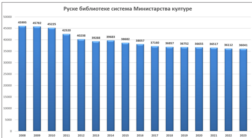
Слика 3. Промена броја библиотека у систему Министарства културе Русије (искључујући независне структурне јединице које обављају библиотечку делатност) у периоду 2008–2023 године. 4

Континуирани пад издавачке продукције има директан утицај на све институције повезане са дистрибуцијом и складиштењем штампаног материјала. Ово се односи на књижаре и библиотеке, чији број у Руској Федерацији у последњих деценију и по константно опада (Слика 3).