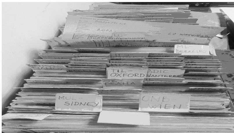
Слика 1: Картон баланса

Током година ови подаци су постали бројни и обимни, на десетине поља 997 унетих у запис за сваки послат број оптерећивало је базу, а запис чинило непрегледним и библиотекарима и корисницима. У договору са начелником Одељења периодике донета је одлука да се прекине са уносом у базу података о слању периодике. Подаци о слању су 2002. године из записа пренети на ручно исписиване картоне, а сва поља 997 са преусмерењем су обрисана из електронског каталога.