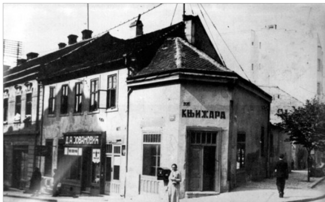
Књижара Велимира Валожића пре рушења

Преминуо је 27. децембра 1887. године у Београду. Након његове смрти остало је сећање на љубазног човека који је дао велики допринос популаризацији књиге и развоју књижевства. Стара књижара и кућа Велимира Валожића срушени су после Другог светског рата.