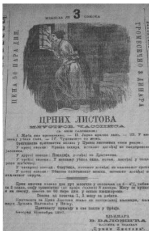
Илустровани часопис Црни листови