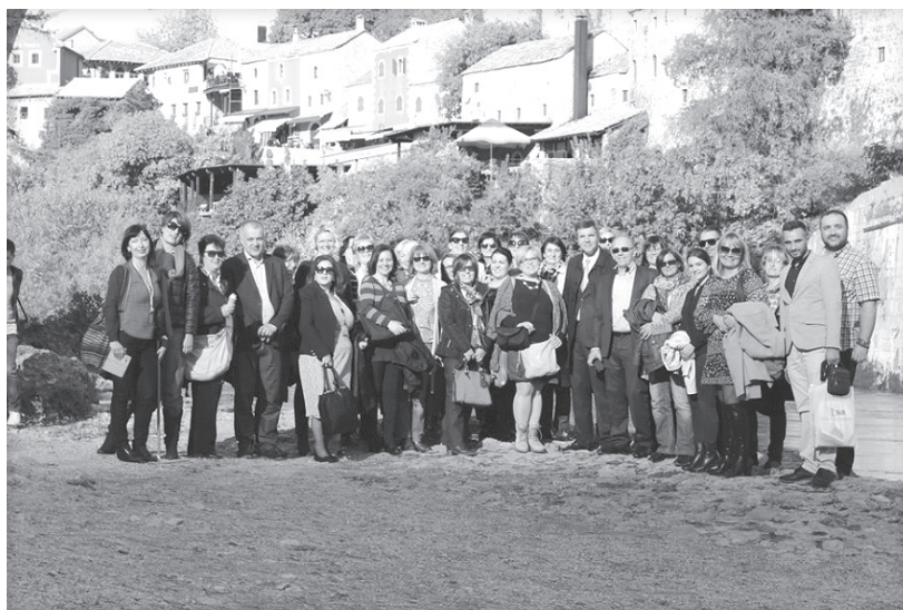
Slika br. 12: Učesnici 9. konferencije BAM 2016 u Mostaru

Zaključci i preporuke sa BAM konferencija se objavljuju u Zbornicima radova i postavljaju na web-stranicu BAM-a, a obavezno se dostavljaju u pisanoj formi resornim ministarstvima, relevantnim institucijama i medijima.