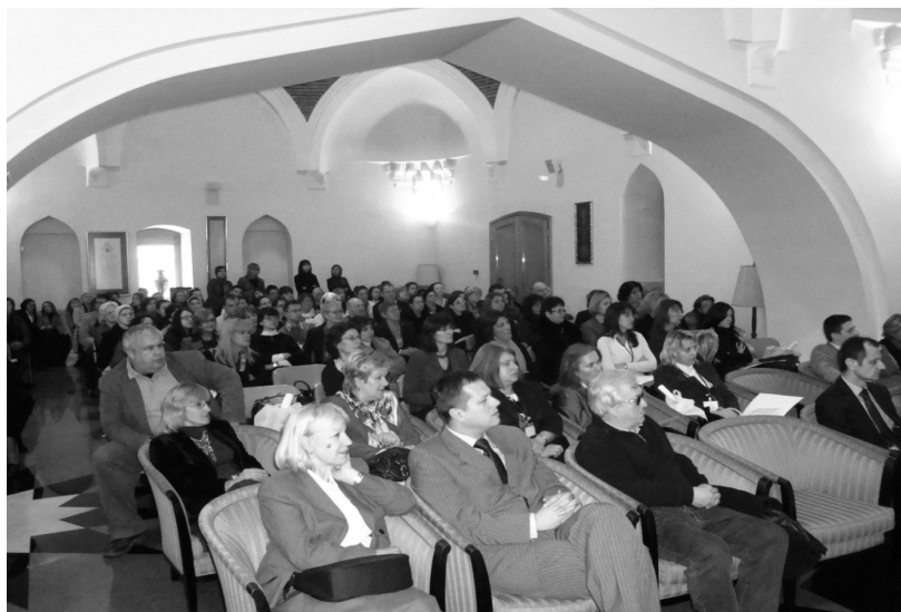
Učesnici 3. konferencije BAM 2009 u Bošnjačkom institutu