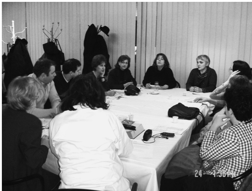
Osnivačka skupština, biblioteka Opće bolnice „Abdulah Nakaš”, februar 2006. godine

Asocijacija BAM je registrirana da djeluje na teritoriji BiH u skladu sa Rješenjem Ministarstva pravde Bosne i Hercegovine . Glavni cilj djelovanja Asocijacije je rad na uspostavljanju bliže saradnje između biblioteka, arhiva i muzeja u Bosni i Hercegovini, širenje naučne i stručne misli, podsticanje međunarodne saradnje, kako bi se provela zaštita, dostupnost, istraživanje, promocija i širenje informacija o kulturnoj i naučnoj baštini uz primjenu novih tehnologija i međunarodnih standarda.