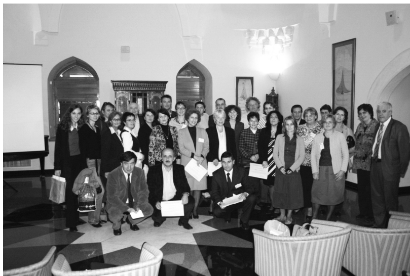
Učesnici 1. konferencije BAM 2007 u Bošnjačkom institutu