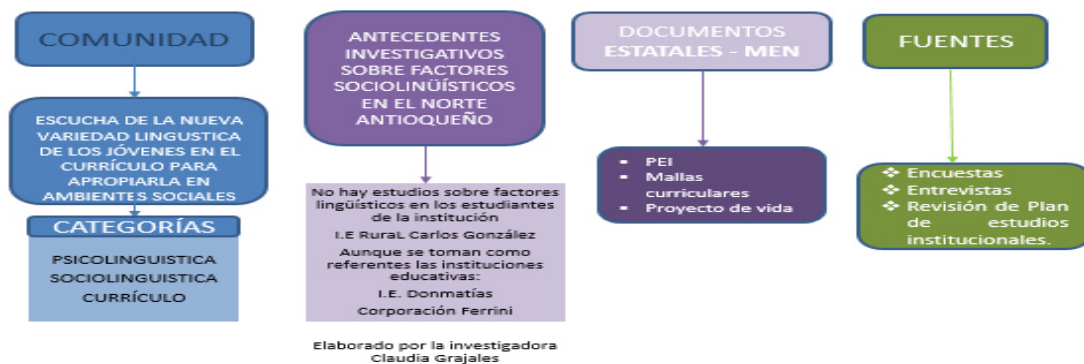
Imagen 1. Ruta de las fuentes de información.

3) Recolección de datos. Se presenta una organización para recoger información relevante en la investigación.