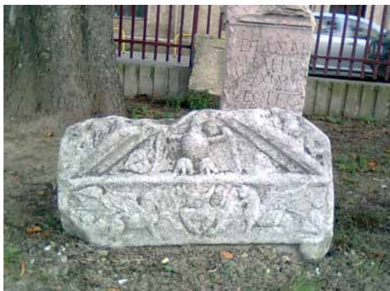
Slika 12. Stela

luraširenih krila sa glavom ulevo, dok su u akroterijama vojne oznake ( signa ) legije VII Claudia sa glavom bika. Spomenik pripada veteranu legije VII Claudia bivšem signiferu iste legije, odnosno zastavniku. 26 Sasvim je jasno što su oznake legije prikazane na spomeniku jednog signifera, dok je orao bio obavezna oznaka svake carske legije. Spomenik se na osnovu formule D(is) M(anibus) najranije može datovati u II-III vek kada se navedena skraćenica koristi na gornjomezijskim spomenicima.