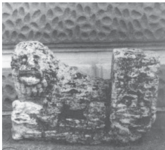
Slika 2. Lav (Zotović, 2003, 94).