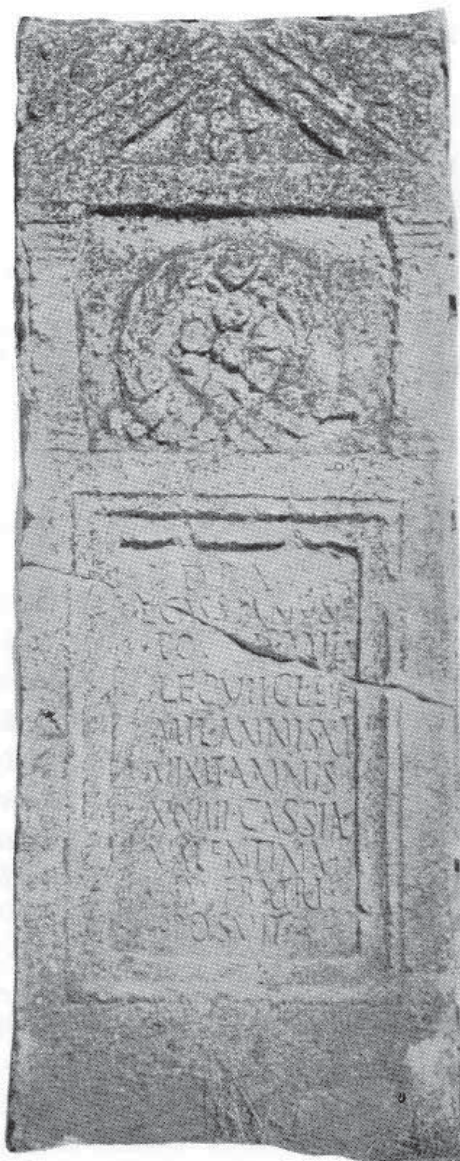
Slika 10. Stela (Mirković 1986, 141)