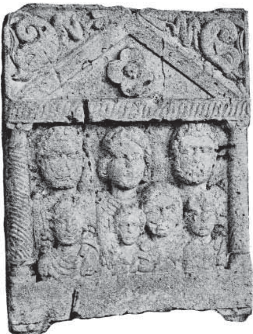
Slika 11. Stela (Mirković 1986, 170)