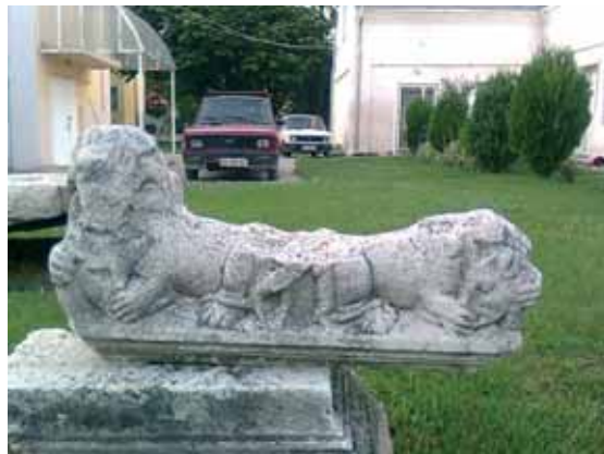
Slika 1. Lav