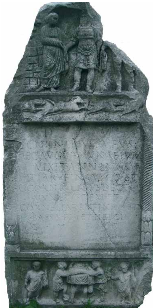
Slika 15. Stela (Mirković 1986, 110-111)