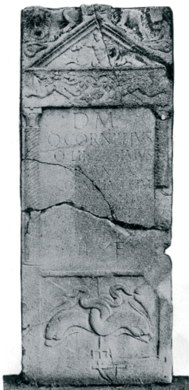
Slika 5. Stela (Mirković 1986, 167)

Lavove na stelama iz Viminacijuma možemo podeliti u dve grupe: