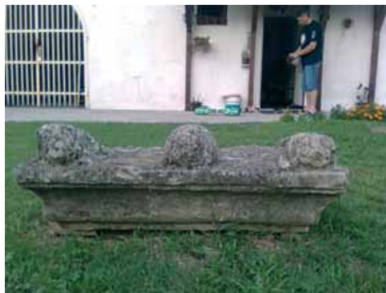
Slika 3. Lavovi