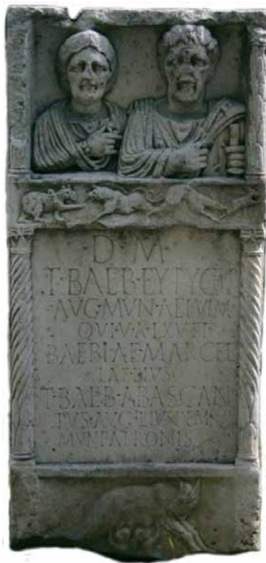
Slika 17. Stela

Na osnovu materijala, reljefne obrade i dekorativnih elemenata, stele iz Viminacijuma su uglavnom delo domaćih majstora. Rađene su od krečnjaka boljeg ili lošijeg kvaliteta, peščara (slika broj 2, 3, 8-12 i 16) i mermera (slika broj 1, 4-6; 13-15 i 17). Peščar i krečnjak su domaćeg porekla, možda iz tašmajdanskih kamenoloma. Kamenolomi u blizini Viminacijuma nisu konstatovani, a najbliži bi bio tašmajdanski. Mermer