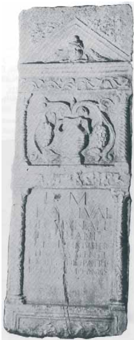
Slika 16. Stela (Mirković 1986, 113)

3 – jelen i košuta su prikazani u frizu stele (slika broj 16) i u sceni lova na steli (slika broj 4). Jelenji rogovi se često povezuju sa drvetom života i simbolizuju prirodni tok – umiranje i rađanje. U grčkoj mitologiji jelen je simbol brzine i hitrosti. Četiri košute vuku Artemidine kočije, a petu goni Herakle sve do zemlje Hiperborejaca. Ova košuta simbolizuje mudrost koju je teško stići, odnosno steći. Kod Kelta je lov na košutu tretiran kao traženje mudrosti koja se nalazi ispod drveta jabuke, odnosno stabla spoznaje. 36