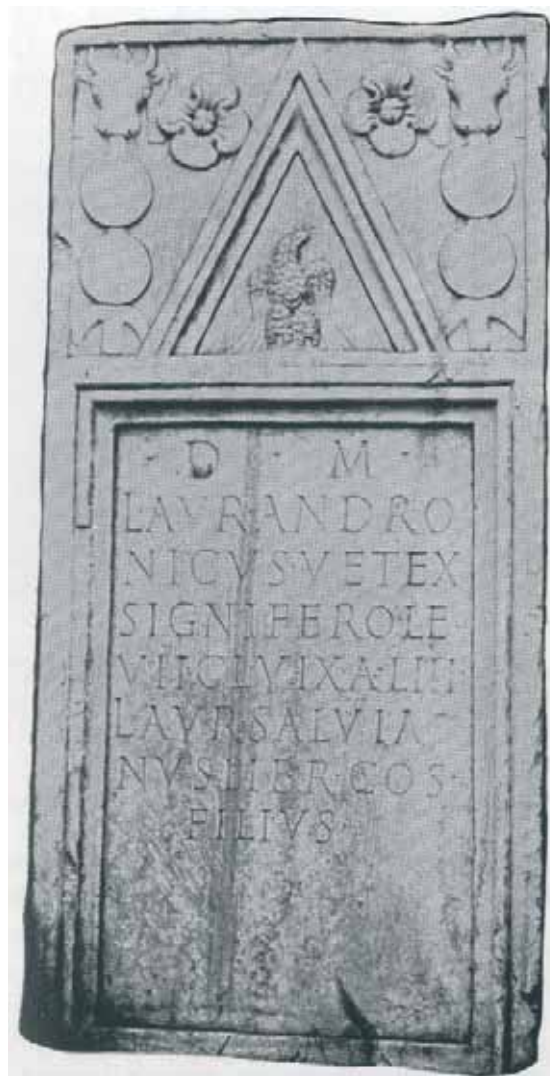
Slika 13. Stela (Mirković 1986, 136-137)

Analogni primerci s prikazom orla u zabatu su poznati iz Singidunuma i Guberevca 27 međutim, zastupljeniji su u zapadnim provincijama Carstva (Norik, Panonija i Dalmacija), a često je uz orla prikazana još neka ptica, kao što je slučaj na steli iz Basiana ili kao zmija na spomeniku iz Murse. 28 Stele s motivom orla iz zapadnih provincija su datovane u I – II vek, dok iz Gornje Mezije u drugu polovinu II i početak III veka.