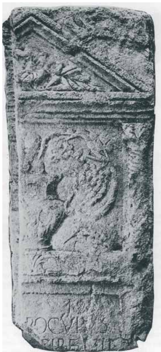
Slika 8. Stela (Mirković 1986, 166)

čudovište. Simbolika delfina se vezuje za vodu kao njihovo prirodno boravište. Mnoga božanstva su iz grčke mitologije preuzimala oblik delfina kako bi došla do određenog cilja. Tako se Apolon pretvara u delfina da bi došao do Krisa, pristaništa na Delfima. Na Apolonovom tronošću je bio prikazan delfin, kao simbol proricanja, mudrosti i opreznosti. 18 Delfin je povezan sa Posejdom uz čiju je pomoć zadobio ljubav Amfitrite. 19 Stoga je