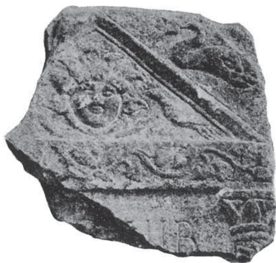
Slika 7. Stela (Mirković 1986, 172)