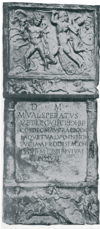
Slika 4. Stela (Mirković 1986, 130)