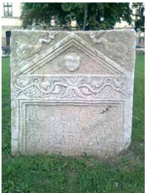
Slika 6. Stela