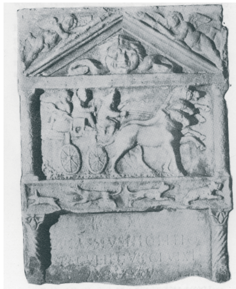
Slika 14. Stela (Mirković 1986, 128)