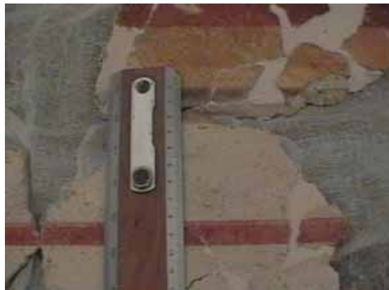
sl. 3. Nivelisanje fragmenata u pesku, pre nanošenja maltera

tak. Po obliku se može datovati u drugu polovinu trećeg veka. Novac nađen tokom iskopavanja unutar prostorije broj 2 koja pripada istoj građevinskoj i hronološkoj fazi je brojniji. Najraniji primerak pripada periodu vladavine Septimija Severa (193–211), dok su ostali primerci iz sredine ili s kraja III veka. Poznat je po jedan primerak bronзанog novca Gordijana III sa suprugom Trankvilinom sa natpisom na grčkom (238–244), zatim Valerijana (253–260), Galijena (253–268) i Klaudija II Gotskog (268–270). Pronađeno je čak 18 bronzanah novčića Aurelijana (270–275) kovanih u tri različite kovnice: Siscija, Mediolanum i Kizik. Devetnaesti primerak je iskovan u čast njegove supruge Severine. Iz perioda vladavine cara Proba (276–282) potiče šest novčića, dok jedan pripada vladavini Karusa (282–283), a dva su iz vremena Maksimina (286–305). Najmlađi novac pripada Konstantinu II (341–346), a u IV vek su datovana dva spleljena i korozijom oštećena novčića.