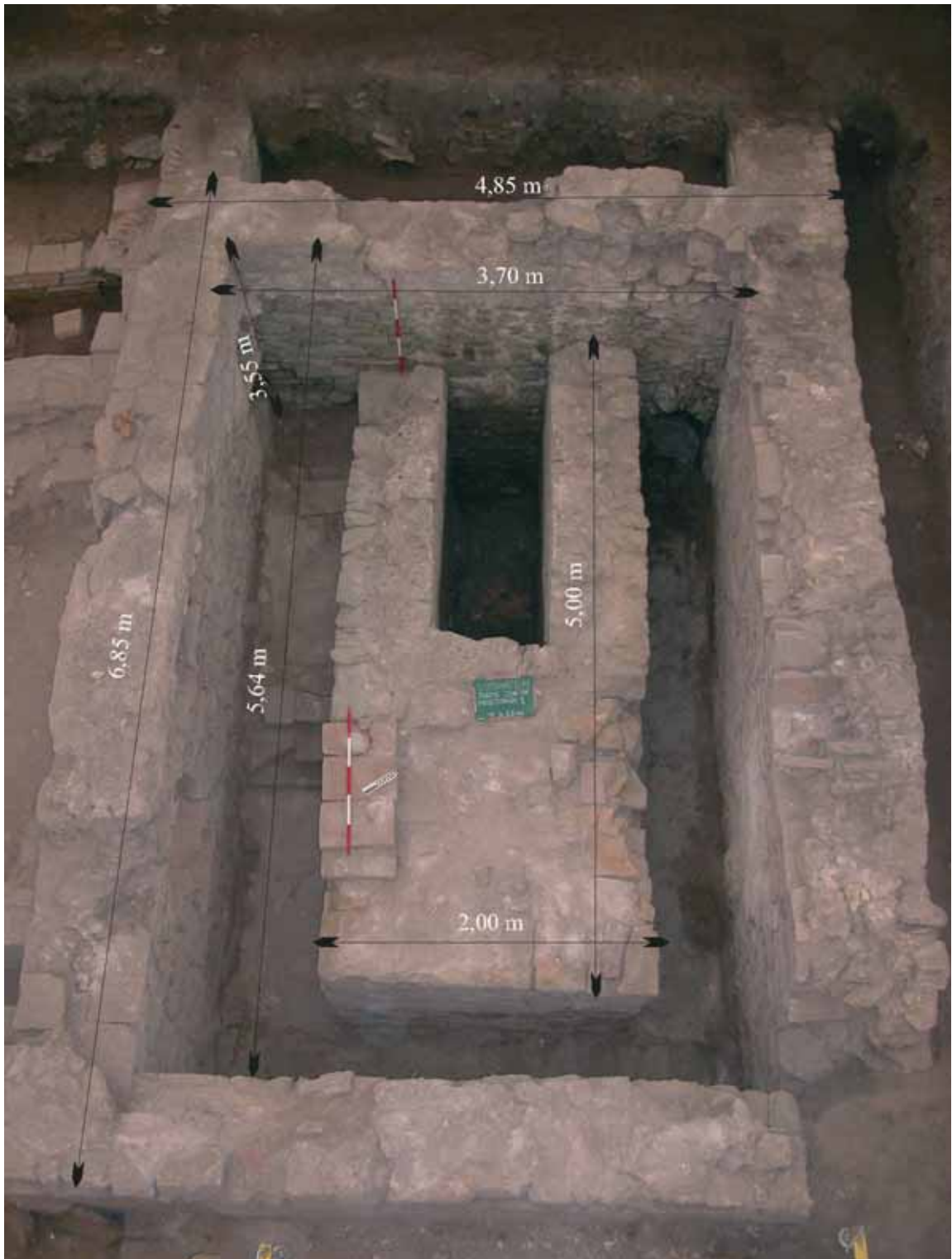
Slika 1. Prostorija broj 1.