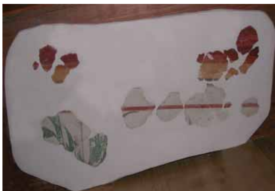
sl. 12. N-7 Ova slikana dekoracija ima više planova: u donjoj zoni predstavljen je floralni motiv zelene boje na krečno beloj pozadini maltera, iznad njega nalazi se bordura čija širina iznosi 13 mm, gornja zona ove celine nastavlja se na belu pozadinu širine oko 5 cm (tanka crvena bordura je 13 mm; žuta 5 cm, a svetlocrvena oko 4 cm)

ovlađuju uglavnom nijanse crvene i ljubičaste, i plava, žuta i zelena boja. Posebna je celina sa floralnim motivima izvedenim zelenom bojom dok je za pozadinu iskorišćena krečno bela površina. Ovaj motiv se završava crvenom, horizontalnom bordurom na koju se nastavlja deo linearnog ta-