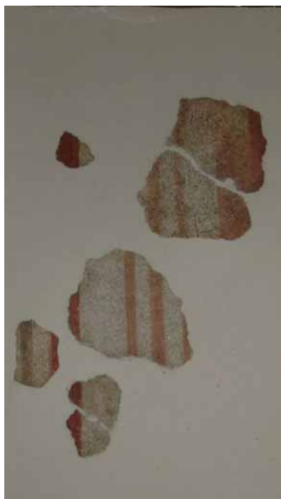
sl. 9. N-4

širina sivkasto-ljubičaste bordure je 1 cm; širina najtanje svetlo crvene bordure je 8 mm; deblja crvena bordura je 1 cm široka; najdeblja lazurno crvena je 3,3 cm;