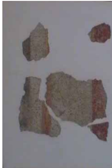
sl. 8. N-3 Na beloj pozadini prikazana je plava bordura, žuta čija je širina oko 2 cm i crvena.