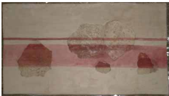
sl. 10. N-5 Na beloj pozadini prikazane su dve bordure, šira čija je širina 6 cm, i uža čija je širina 7 mm. Jedino je na ovom primeru urađena restauracija.