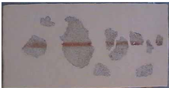
sl. 11. N-6 dimenzije ovog nosača su: 54 x 24 cm, crvena bordura je 13 mm