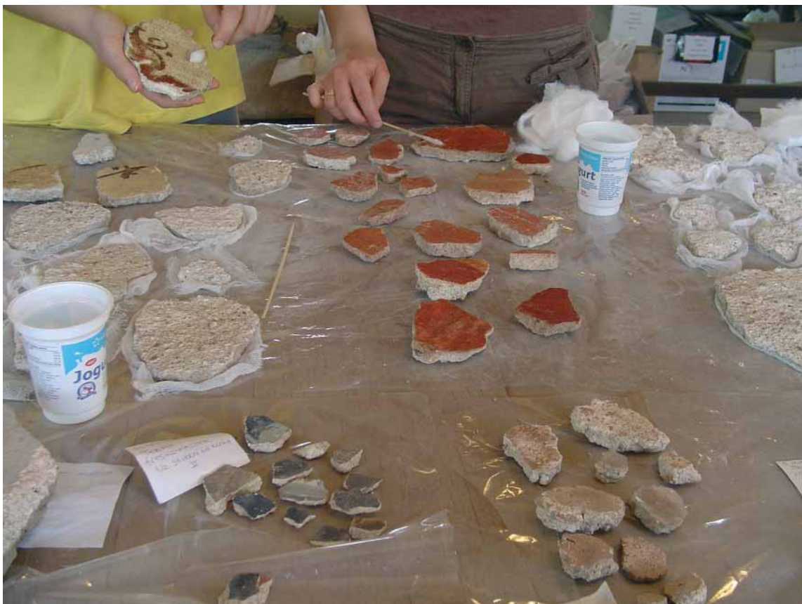
sl. 1. čišćenje fragmenata fresaka čije su poledine iznivelisane postupkom opisanim u tekstu

kamena peščara i zelenca, maltera i sitnozrnog žutog peska), na koti od 79,78 m naišlo na prve fragmente zidnog slikarstva. Dimenzije spoljnih zidova prostorije su 6,85 x 4,85 m. Širina zidova varira od 0,65 do 0,77 m. Prostorija je sačuvana u nivou ispod poda, sa visinom zidova od 3,55 m, dok je sama podnica bila probijena.