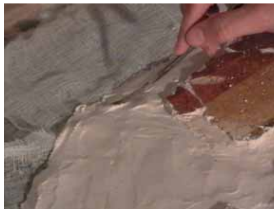
slika 5. nanošenje maltera