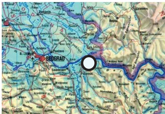
Viminacium, Stari Kostolac, Srbija LAT 44° 44' 09" / LONG 21° 12' 42"

UDK 904:75.052"652"(497.11) ; 902.2(497.11)"2003/2004" Izvorni naučni članak