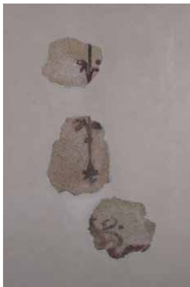
sl. 6. N-1, slikani motiv rađen ljubičasto-crvenkastom bojom