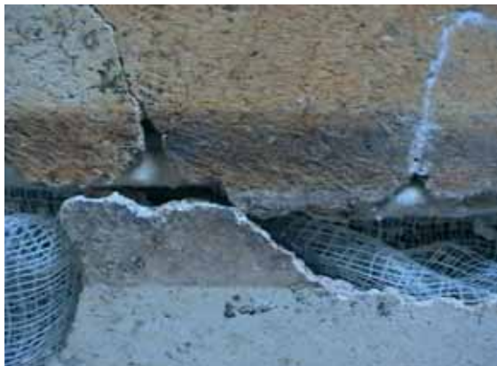
sl. 2. Spajanje fragmenata po slikanom motivu