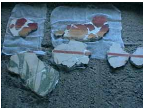
slika 4. spajanje fragmenata u pesku, prvo su spojene manje celine koje su se kasnije uklapale u konačnu celinu

Kada se sve ovo dobro osušilo nosač je podignut i okrenut na poledinu, na ravnu podlogu preko koje je bila postavljena sunderasta substruktura i melineks da ne bi došlo do nekih oštećenja na licu freske. Urađeno je nivelisanje poledine dodavanjem maltera da bi se dobila ravna površina na koju se mogu dalje nanositi slojevi maltera da bi se formirao nosač freske. Nanešena su još dva sloja maltera. Posle sušenja maltera cela površina