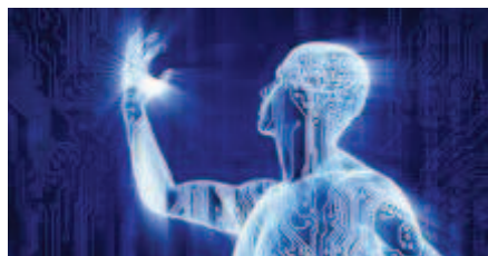
Слика 13: Трансхуманизам