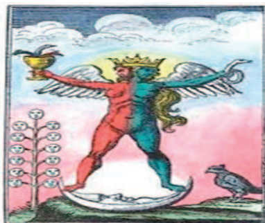
Слика 3: Соларна и лунарна савест

осећајем отуђења од породице, групе вршњака или племенске групе. Свесно доживљавање појединца ће бити пребојено осећањем изолованости и усамљености.