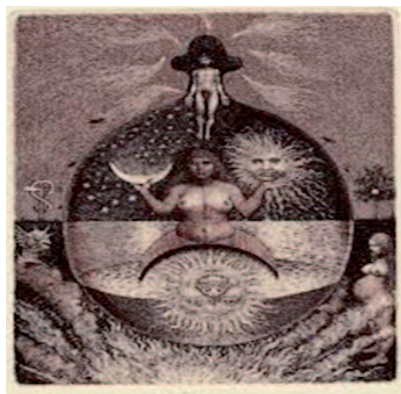
Слика 2: Соларна и лунарна савест

Како да останемо свесни онога што радимо? Иманентни представник Јунгове школе, теолог и аналитичар, Мари Стајн (Murray Stein), један је од аутора који се бави овим питањем. У свом делу Соларна савест, лунарна савест , аутор се бави моралним и етичким поступањем. По њему, соларна савест је унутрашњи глас или унутрашњи водич којег препознајемо кроз доминантне обрасце мишљења и понашања особе у њеном свесном животу. Он сматра да су наши доминантни свесни обрасци углавном идентични са онима који владају у колективу у коме живимо. Из овог разлога, соларна савест представља скуп социјалних правила и обичаја, устаљених навика и очекивања у нашој култури. Она, дакле, говори о законима и правилима који управљају културом, а које већина углавном усваја и као важећа ограничења у понашању појединца (Stein 1993: 24). Очигледно је да у овом принципу „групно“ узима превагу над „индивидуалним“ и да се личне жеље морају повинovati законима културе. „Соларна савест захтева од нас одговорност према друштву, она обухвата законе и правила доминантних образаца групе и налаже нам да ова правила поштујемо чак и у најинтимнијим односима (Stein 1993: 25)“. Препознајемо је у оквирима принципа мушкости – логоса. Кршење закона соларне савести ће код већине особа проузроковати осећај кривице и социјалне анксиозности, а биће пропраћено и