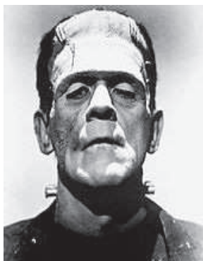
Слика 5: Креација Виктора Франкенштајна

Размотрићемо портрет Виктора Франкенштајна са аспекта јунковских принципа психолошке мушкости и женскости. Пред нама је човек који се у младости дивио и посвећено бавио изучавањима Парацелзуса и других истраживача у алхемији. Израстао је у младог научника који оставља за собом ова знања, води га рационална научна страст и креће се у сферама логоса . Какве податке нам пружа Мери Шели за сагледавање његове психолошке биографије?