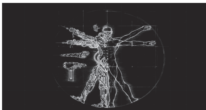
Слика 1: Трансхуманизам