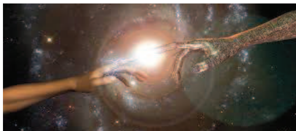
Слика 14: Будућност