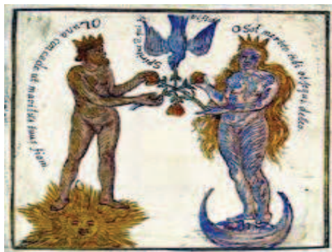
Слика 4: Ерос и Логос

Поменули смо да два облика савести имају повезаност са женским и мушким психолошким принципом. Почетак људског живота се одвија под окриљем мајчинског, женског – у симболичком смислу, а најчешће и у објективном. Мајчинска љубав је та која отвара пут психолошког развоја, уводи људску јединку у свет односа са другим припадницима људске врсте. Као у културолошком периоду матријархата, тежи се прихватању и успостављању хармоније међу различитим бићима и у односу са природом. Следећа фаза се одвија у односу са очинском фигуром на индивидуалном плану, а у култури одговара патријархату. Овде се у односима успоставља хијерархијска структура (по старости, роду и сл.) чиме је одређена и позиција моћи, односно – послушности. Ризик ове фазе је успостављање духовне атмосфере која није у складу са природним поретком, а даљим фаворизовањем оваквог стања долази се до етике која се може означити као opus contra naturam (Stein 1993: 67).