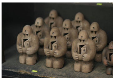
Слика 9: Голем