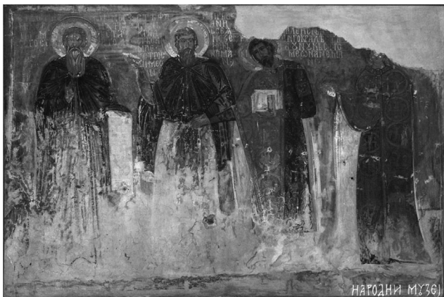
Слика 2. Радослављева припрата, параклис Симеона Немање, ктиторска композиција, 1235.

Један, дакле, ликовни пандан, литерарној сцени смрти старца Симеона налазимо у капели Светог Симеона у Сопоћанима. Иако Свети Сава није више био жив, а ктитор храма је краљ Урош (касније, након очевог свргавања, и Драгутин) утицај његове визије је изузетно присутан. Вероватно настале по угледу на студеничке, ове фреске настављају изградњу култа првог српског светитеља. Иако оштећена, ова сцена упечатљиво показује доследну илустрацију Савиног житија. Свети Симеон лежи на рогозини, око њега су окупљени монаси који се клањају. Старац већ има светачки ореол и држи руке прекрштене на грудима. Фреске које су остале сачуване и које су датоване око 1263. г. показују да је сликар и ове капеле познавао дело Светог Саве и колико веродостојно према тексту приказује последње сцене из живота светитеља.