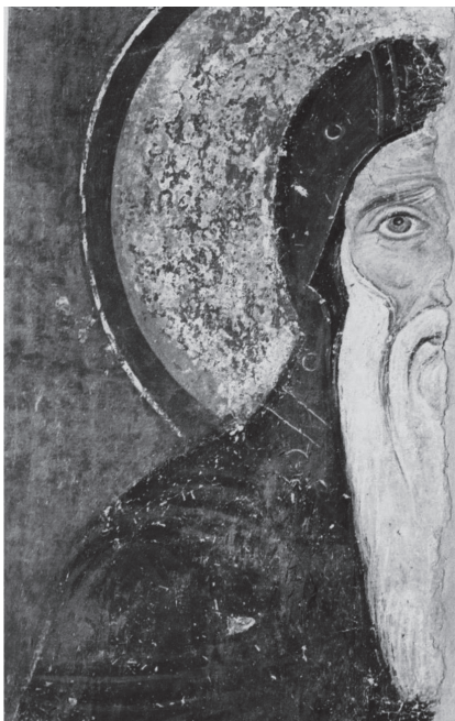
Слика 5. Милешева, Свети Симеон, 1223.

оделу, има седу браду и дубоке плаве очи. Облик лица је изражен наглашеним јагодицама, што заједно са дубином очију упућује поруку о духовној снази и продуховљености насликаног лика. Поглед комуницира са посматрачем, а благо спуштене обрве бацају сену сете на цело лице и дају лику ноту скрушености и изабраног одрицања од свега профаног и трошног. Најречитија је необјашњива светлост којом зрачи светитељево лице, те продорност и мистичност његових светлих очију. Чињеница да је управо овај портрет најдуховнији од свих Немањиних сачуваних портрета, као и присуство спиритуалне светлости на старчевом лицу, доприноси још дубљем разумевању односа оца и сина.