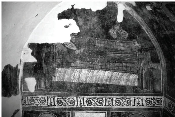
Слика 1. Сопоћани, капела Светог Симеона, сцена смрти, настала 1263. године

Један, дакле, ликовни пандан, литерарној сцени смрти старца Симеона налазимо у капели Светог Симеона у Сопоћанима. Иако Свети Сава није више био жив, а ктитор храма је краљ Урош (касније, након очевог свргавања, и Драгутин) утицај његове визије је изузетно присутан. Вероватно настале по угледу на студеничке, ове фреске настављају изградњу култа првог српског светитеља. Иако оштећена, ова сцена упечатљиво показује доследну илустрацију Савиног житија. Свети Симеон лежи на рогозини, око њега су окупљени монаси који се клањају. Старац већ има светачки ореол и држи руке прекрштене на грудима. Фреске које су остале сачуване и које су датоване око 1263. г. показују да је сликар и ове капеле познавао дело Светог Саве и колико веродостојно према тексту приказује последње сцене из живота светитеља.