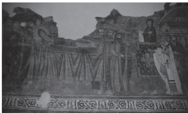
Слика 4. Сопоћани, параклис Симеона Немање, сцена Транслације, 1263.

У Студеници, као и у Сопоћанима нешто касније, фреска која приказује пренос светитељевих моштију из Хиландара у Студеницу, сведочи о нераскидивој вези књижевног текста и ликовног приказа. Ове композиције обилују историјским информацијама, тако да су, осим што илуструју Савино житије, истовремено и илустрације стварног живота. „Синови носе одар са Немањиним телом, а прате их велможе и сви прилазе групи монаха који су изнели икону Богородице Молитељке пред бедеме манастира, чекајући тело светог ктитора. Ликови Вукана и Стефана, синова Немањиних, имају портретску вредност, одећа монаха и епископа је веродостојна...” Остао је забележен и драгоцен приказ тадашње архитектуре цркве манастира Студеница.