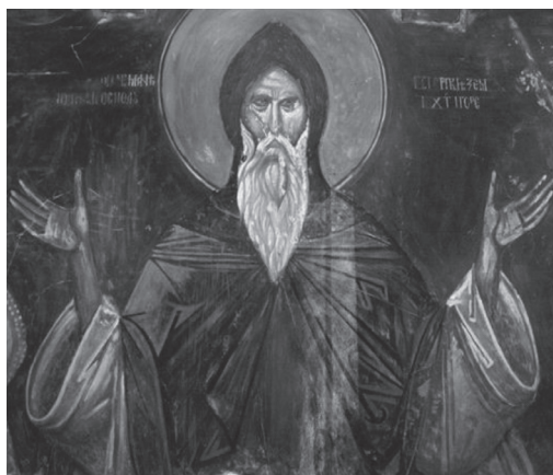
Слика 6. Свети Симеон из Богородице Љевишке, почетак 14. века.

култу ( нпр. Радослављева припрата у Студеници или Сопоћани), на иконама и свим другим ликовним представама, јасно представља одређену поруку и прецизан смисао који превазилази границе приказаног. Та идејна подлога Симеоновог портрета, кроз векове династије Немањића, кроз бурну личну историју њених представника и тешку друштвену историју народа и државе којом су владали, забележену пером и насликану кистом, еквилибрира између световне и духовне димензије његовог лика. У тој дихотомији она гради чврст темељ, корен разгранатог стабла који се над Симеоновим личношћу надвија.