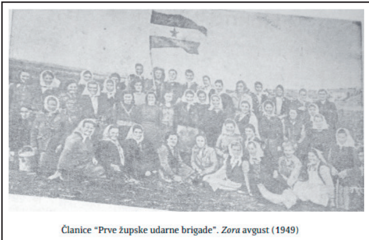
Članice "Prve župske udarne brigade". Zora avgust (1949)